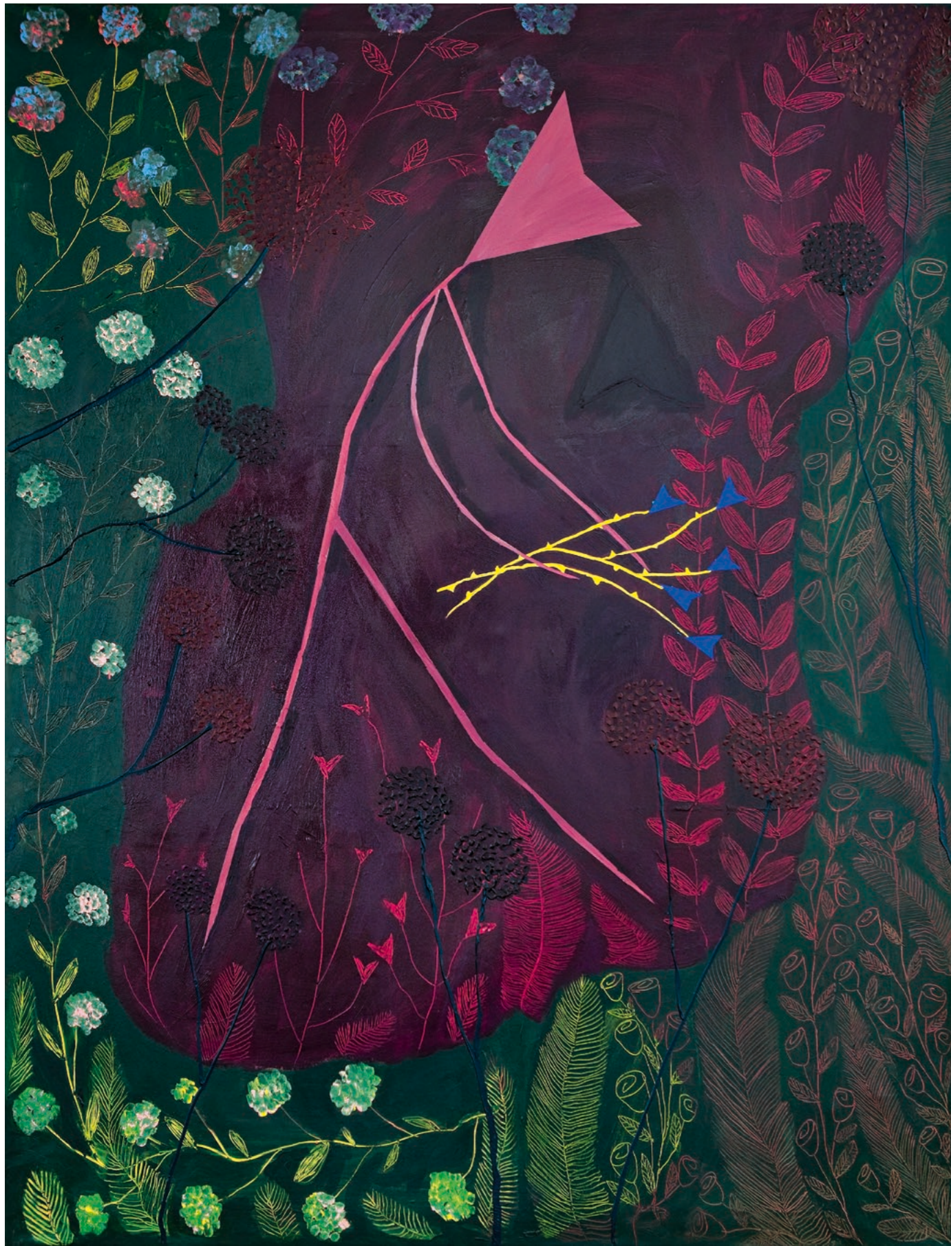
skromnost, 2023 akryl na plátně, 150 x 205 cm