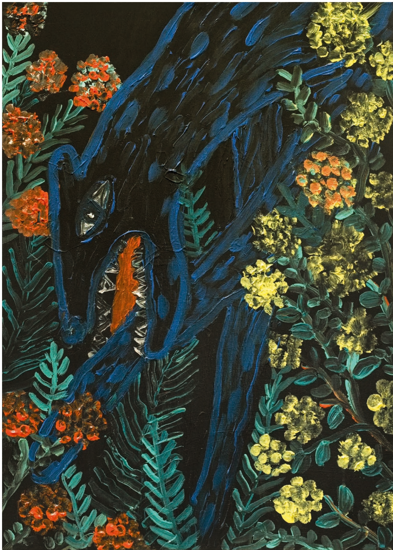
<< na titulní straně: jealousy , 2023, akryl na plátně, 130 x 180 cm