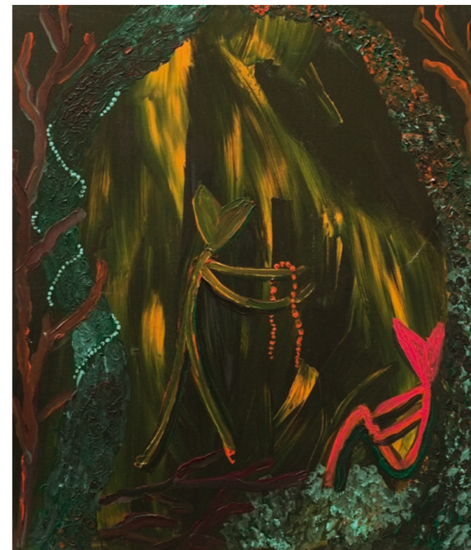
tak už se nezlob , 2024, akryl na plátně, 60 x 70 cm