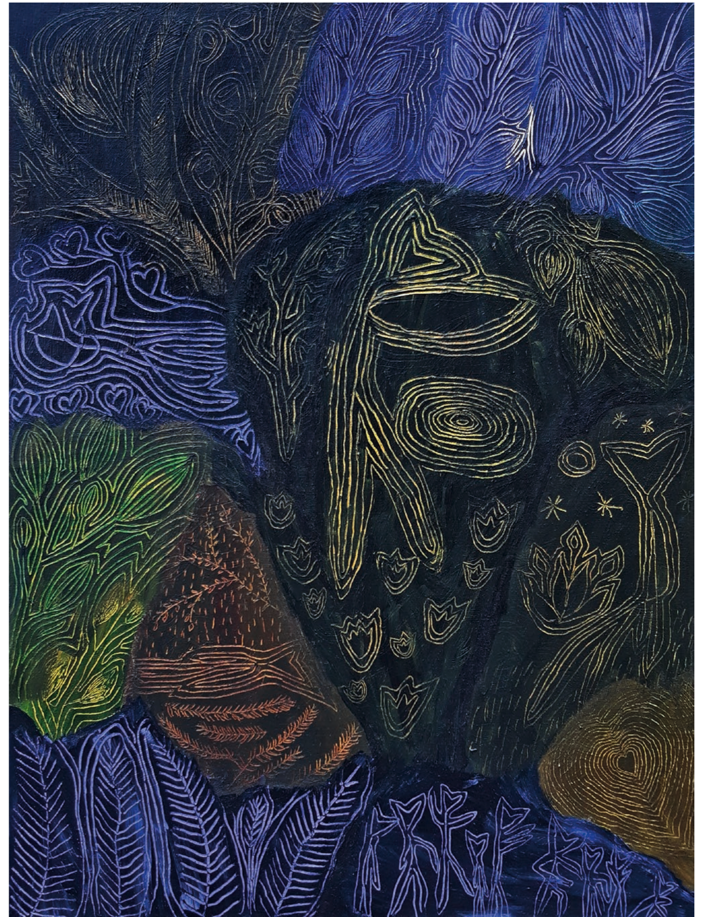
vojáková noc, 2023 akryl na plátně, 150 x 200 cm