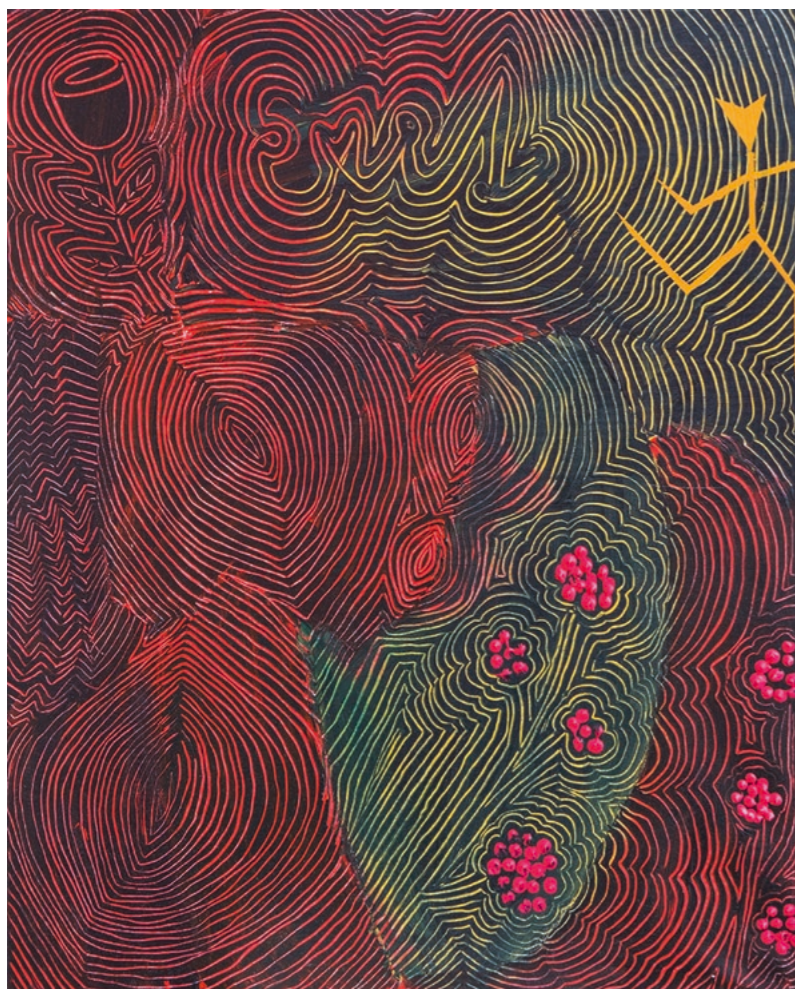
< summertime sadness, 2023, akryl na plátně, 80 x 100 cm