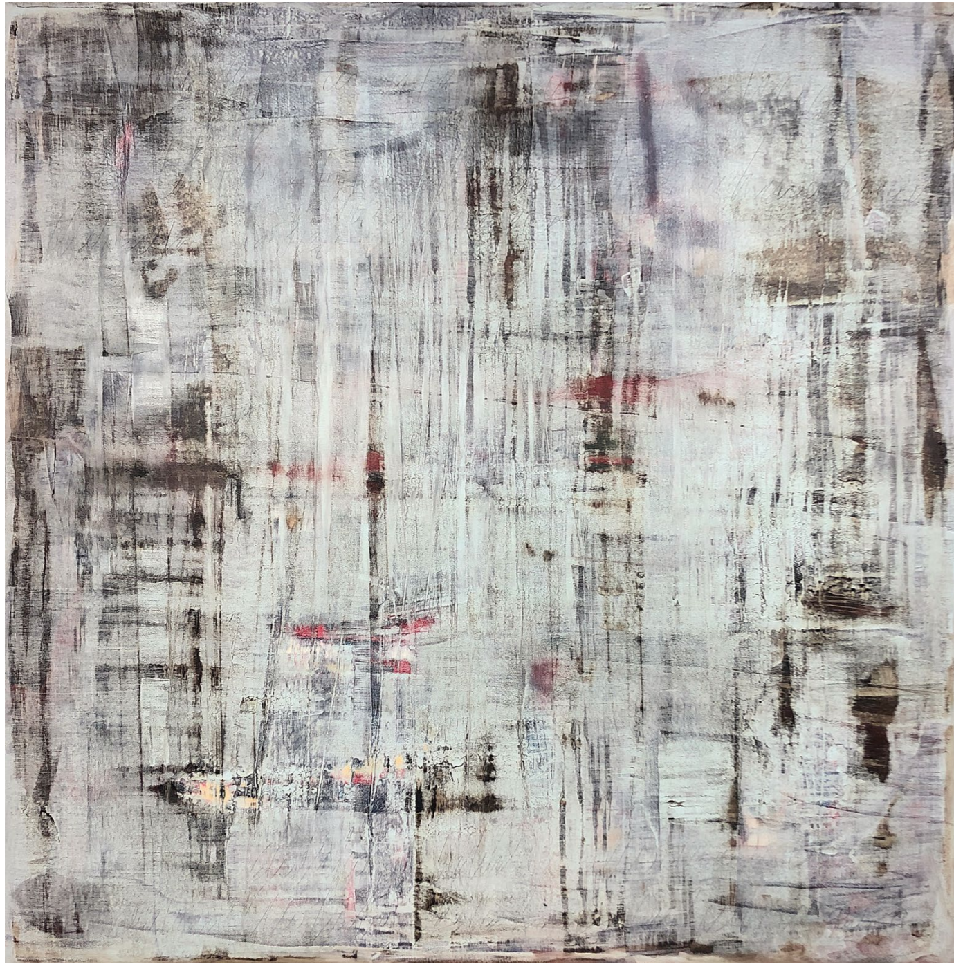
from the series the underdefined places , 2019 canvas, mixed technique, 100 x 100 cm