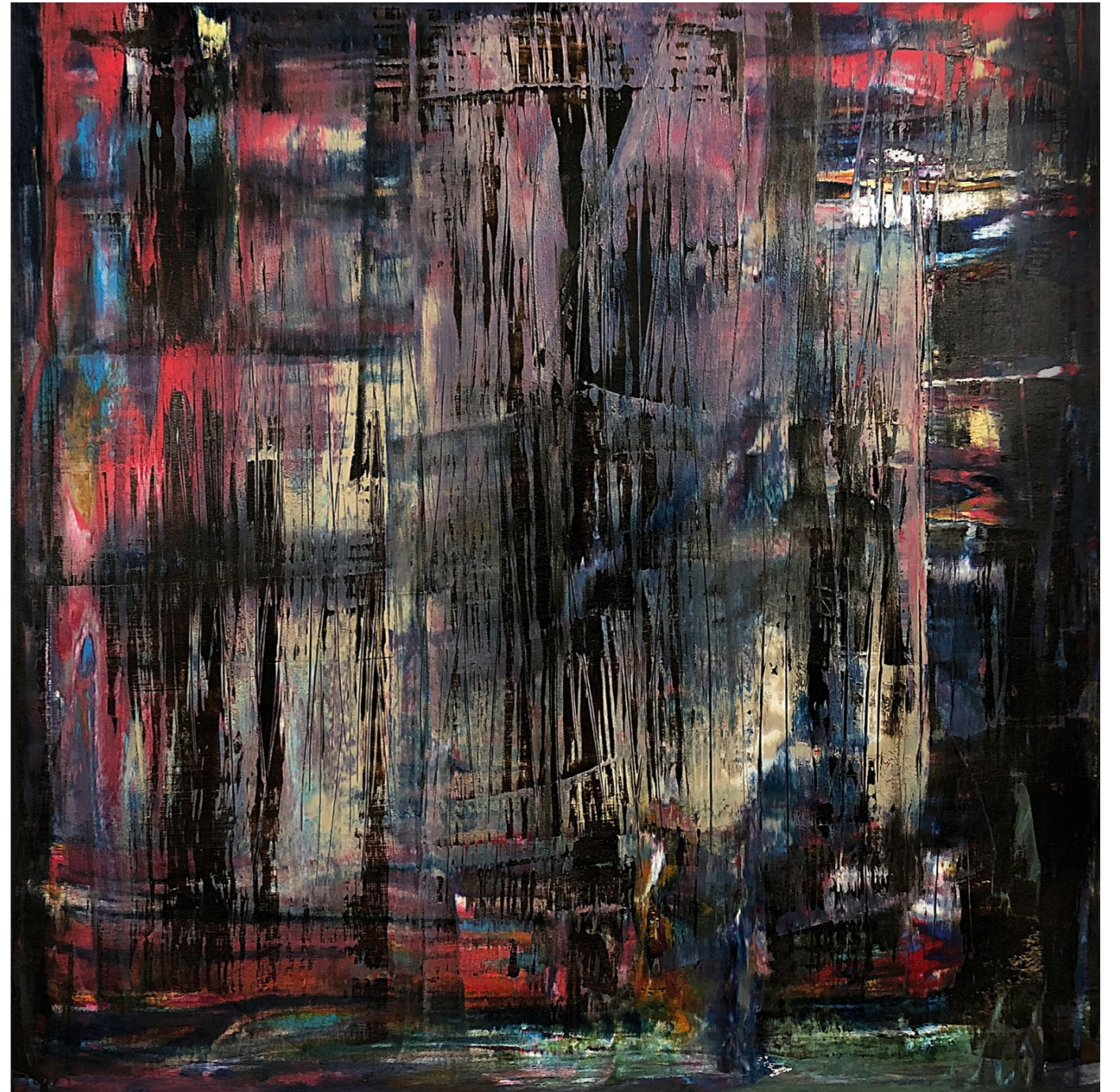
< from the series the underdefined places , 2019 canvas, mixed technique, 100 x 100 cm