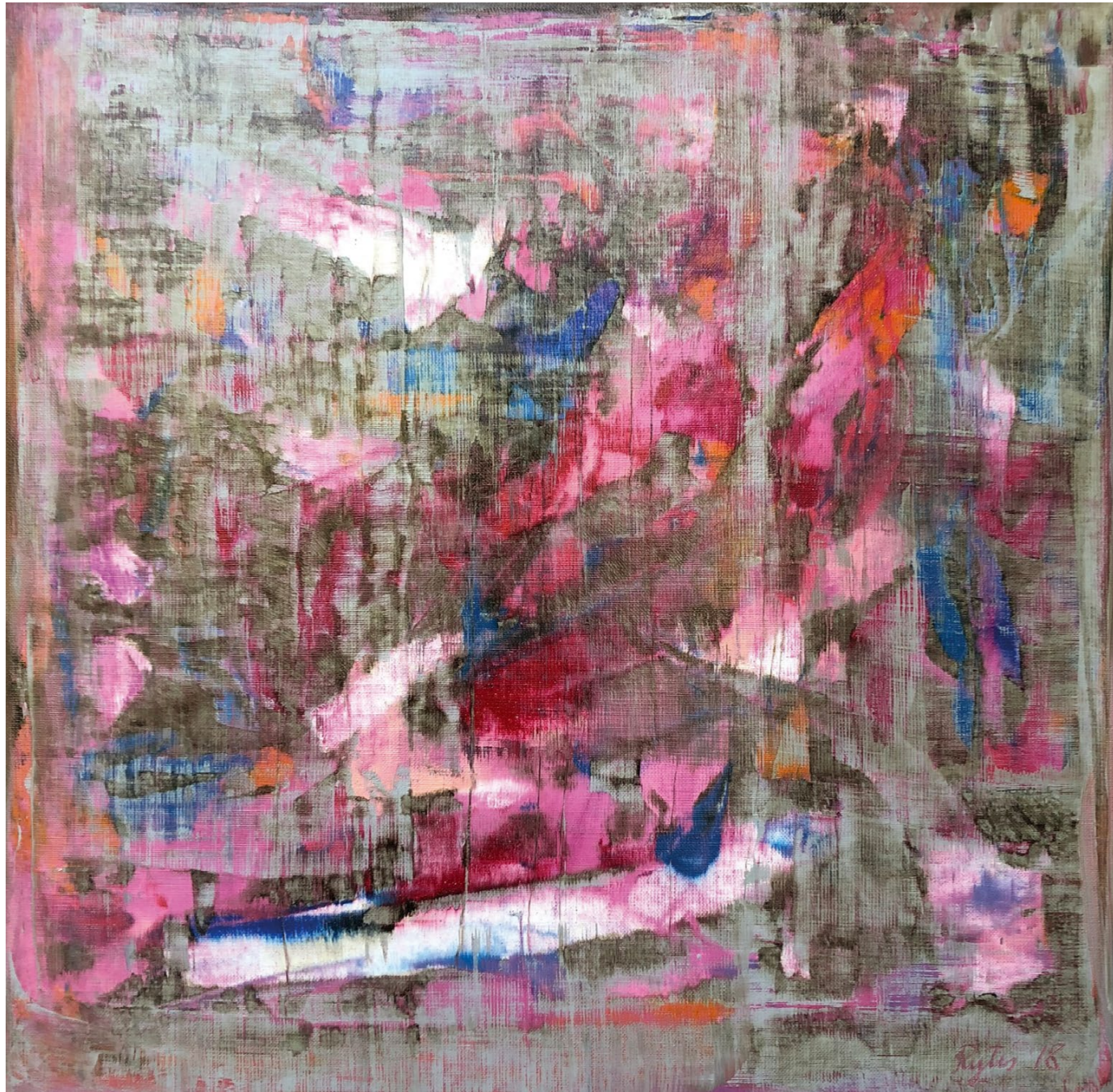
emotionally, 2018 canvas, mixed technique, 50 x 50 cm

> from the series the underdefined places , 2018 canvas, mixed technique, 100 x 100 cm