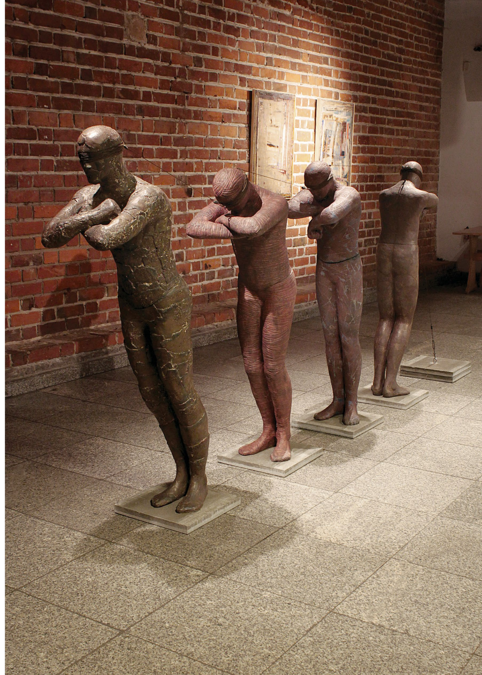
> ambient pressure , 2013 shamotte clay, modeled by hand, glazes, engobe, metal oxides, metal salts, 165 × 300 × 50 cm