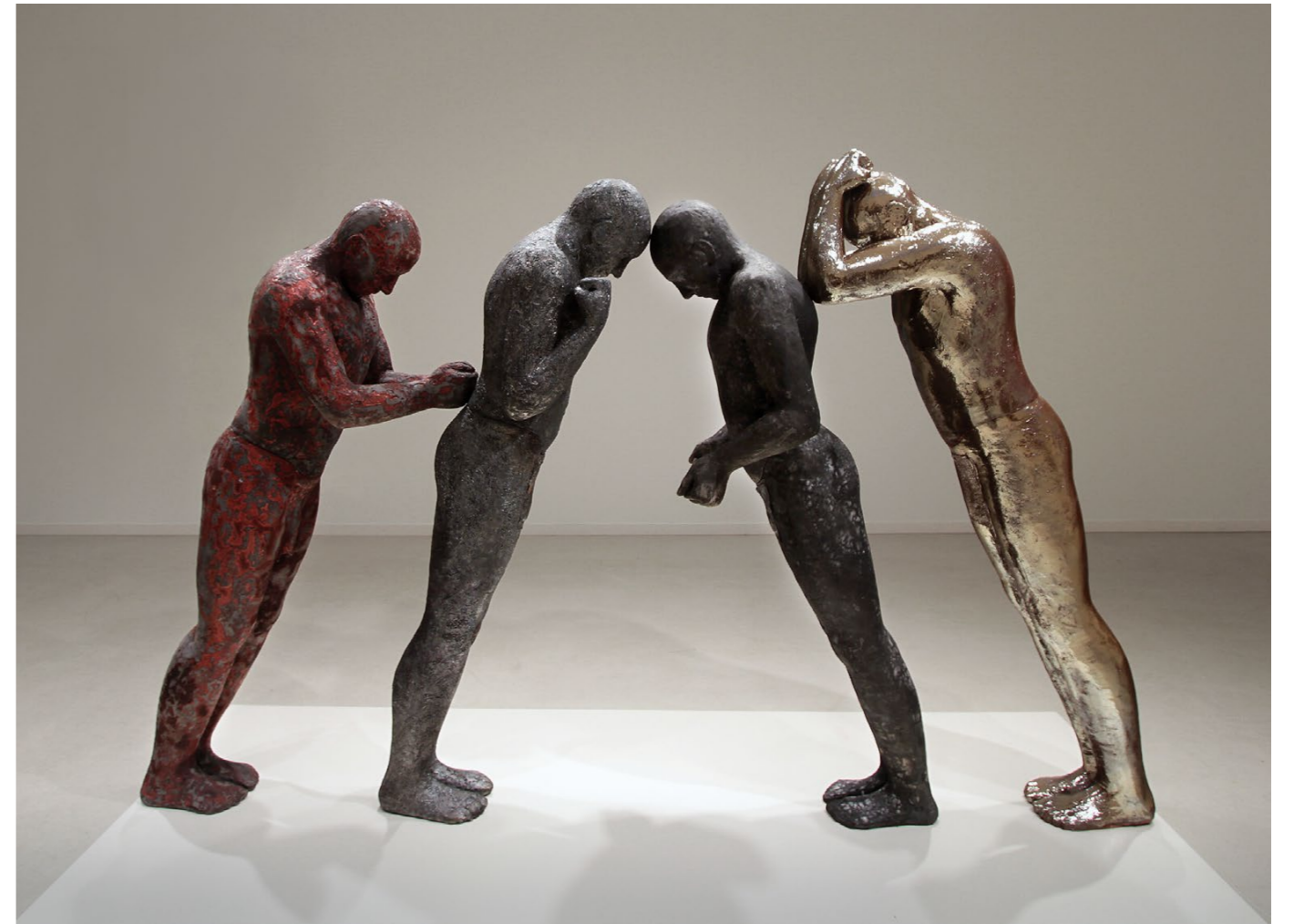
one goal – different ways, 2017–2018 chamotte clay, modeled by hand, glaze, engobe, raku and naked raku firing, 170 × 270 × 60 cm