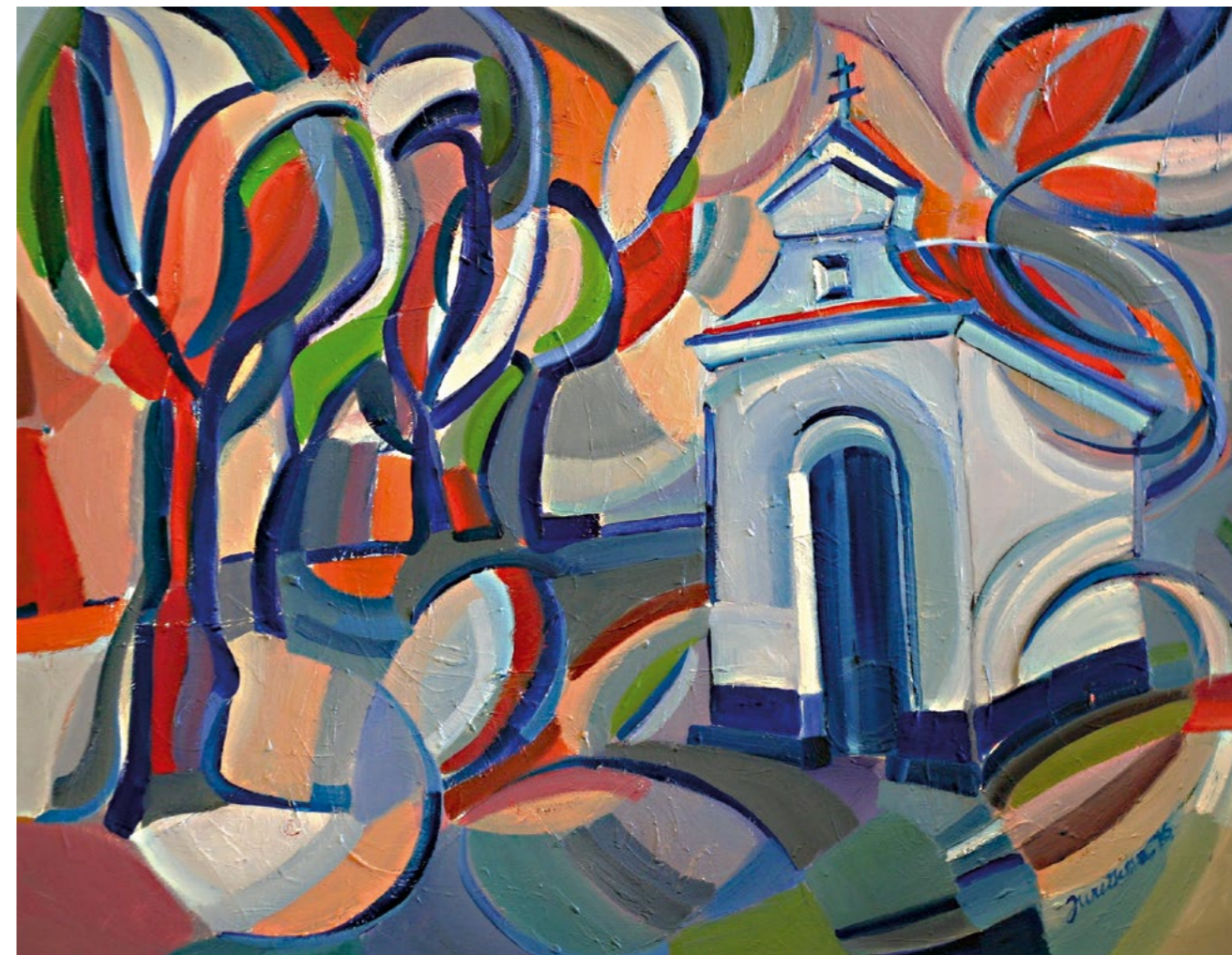
> kaplička sv. jana nepomuckého ve bzenci, 2016, akryl, plátno, 60 x 80 cm blatnické budy, 2015, olej, plátno, 50 x 70 cm