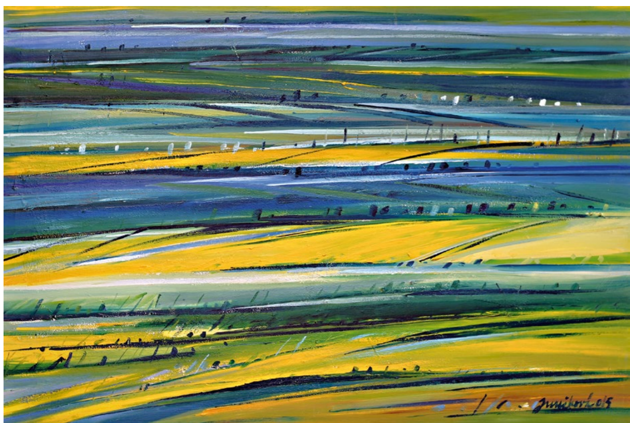
kosení v malé vrbce, 2016, olej plátno, 60 x 80 cm krajina na slovácku, 2015, olej plátno, 70 x 100 cm