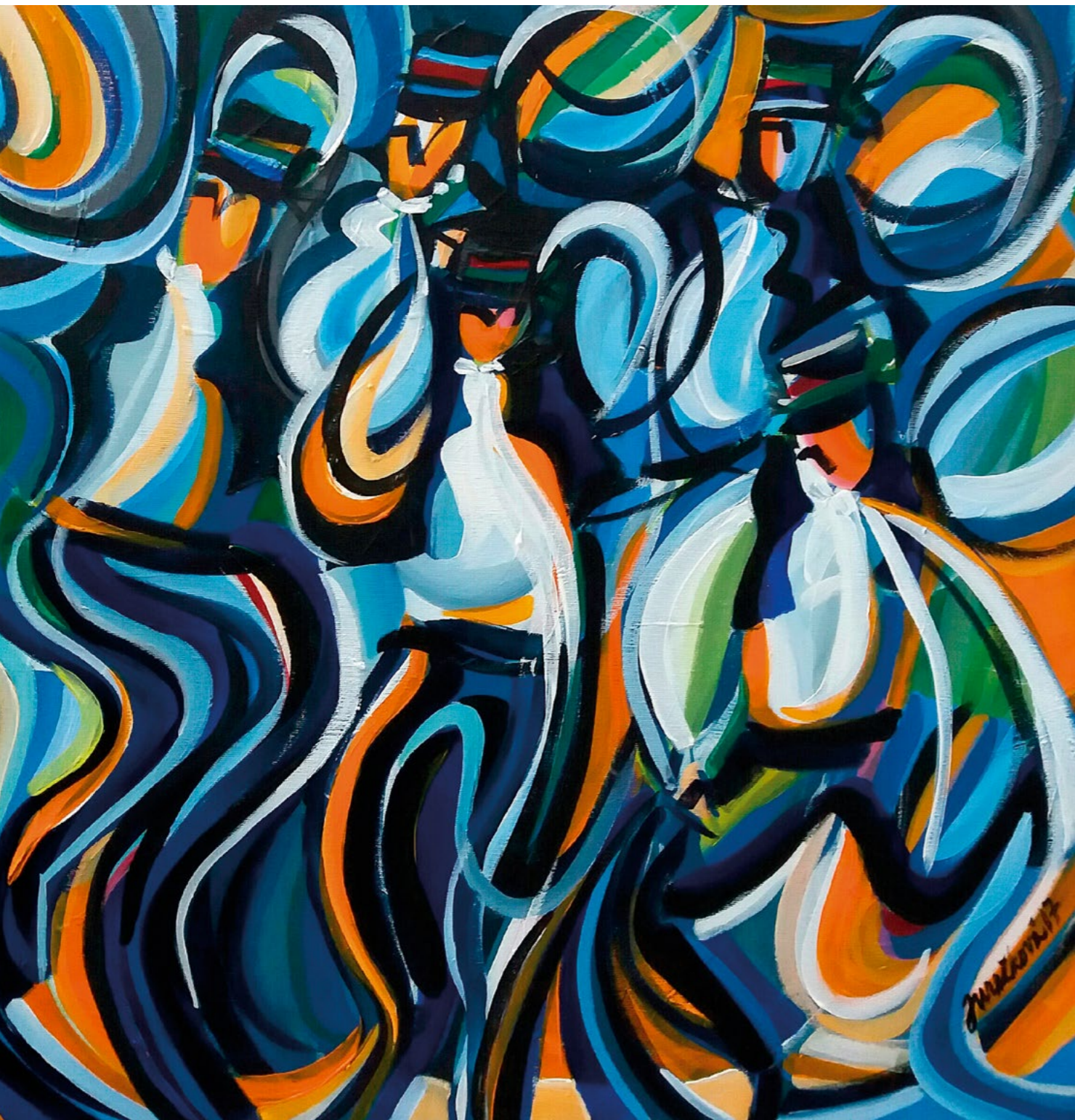
<< hornácká sedlačka, 2019, akryl, plátno, 70 x 70 cm