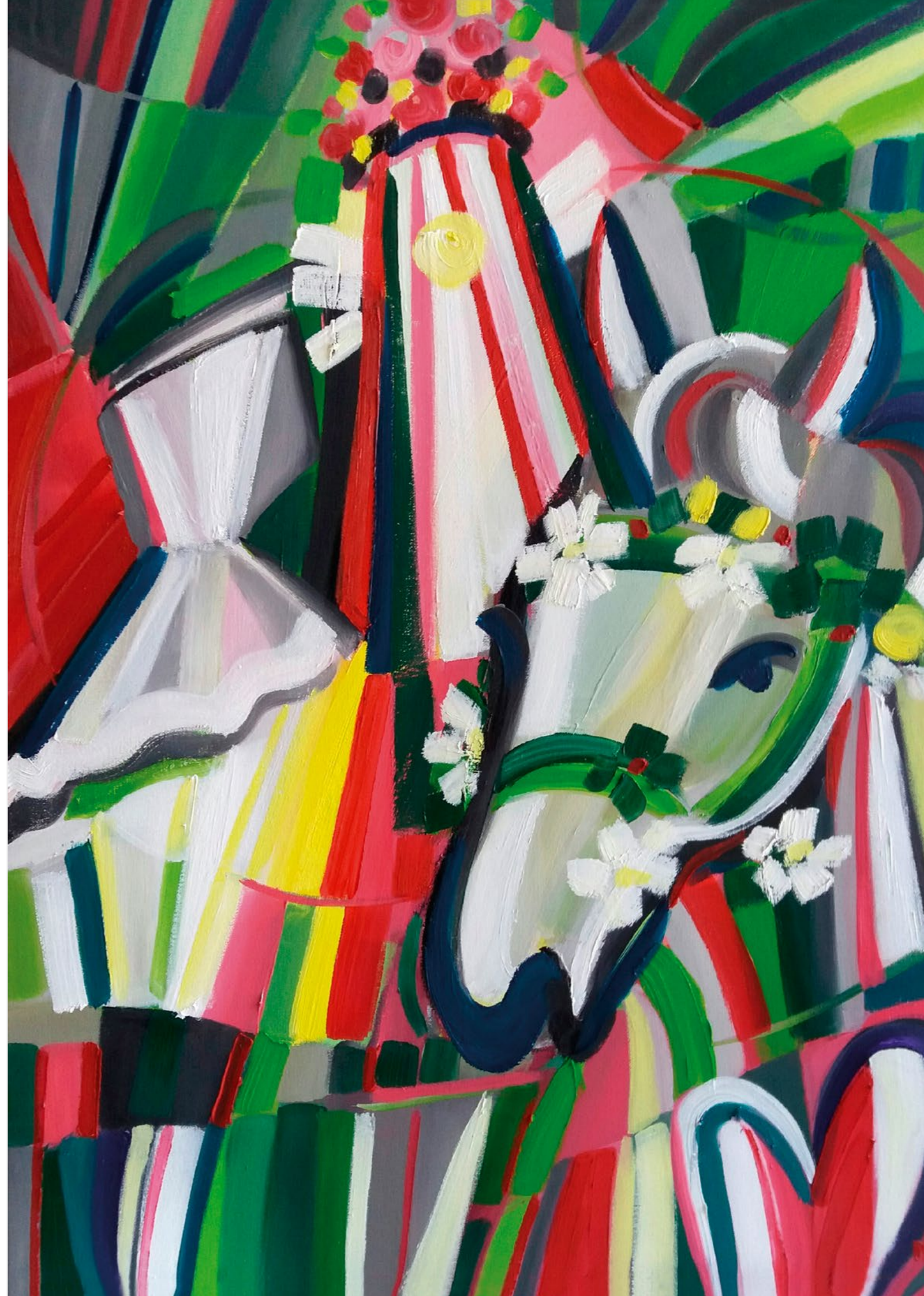
> hlucký král, 2017, olej plátno, 80 x 60 cm