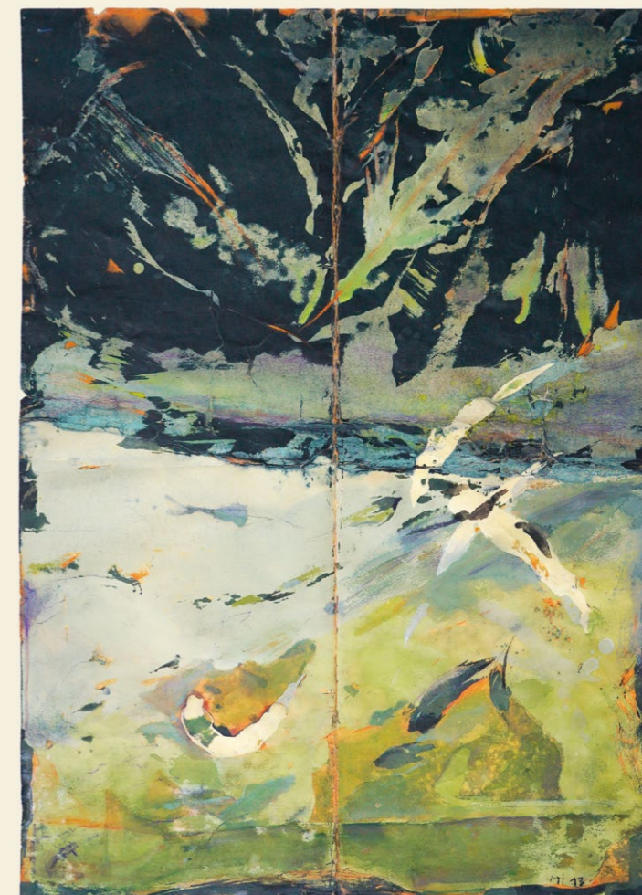
>> poslední strana (detail) křídlo, 2018 autorská technika, 70 × 100 cm