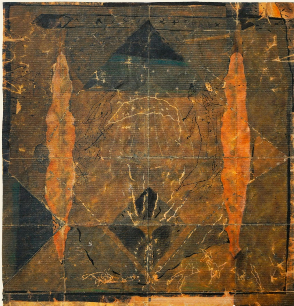
mezi nebem a zemí 1, 2003 autorská technika, 50 x 55 cm