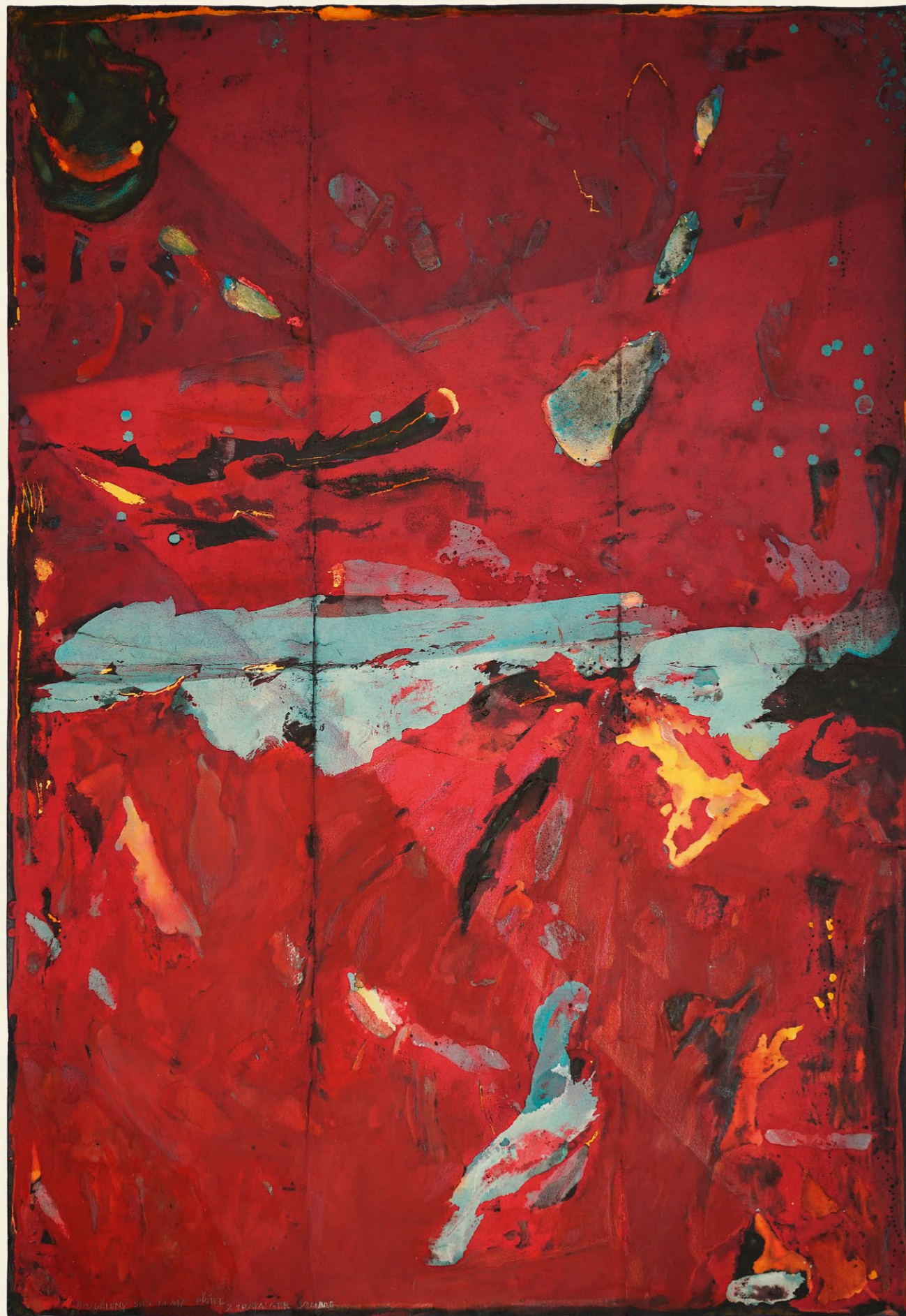
<< titulní strana: svět 3, 2013 vázaná tapiserie, 170 x 170 cm