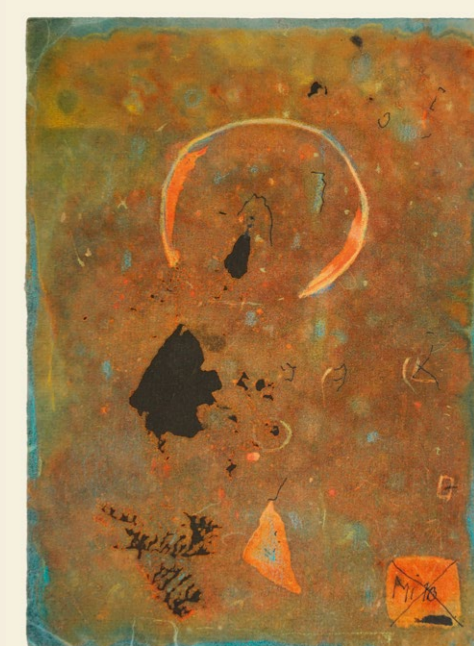
z cyklu starý měsíc, 2013 autorská technika, 10 x 15 cm