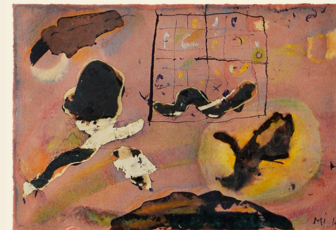
světlo nad nocí 6, 2014 autorská technika, 15 x 10 cm