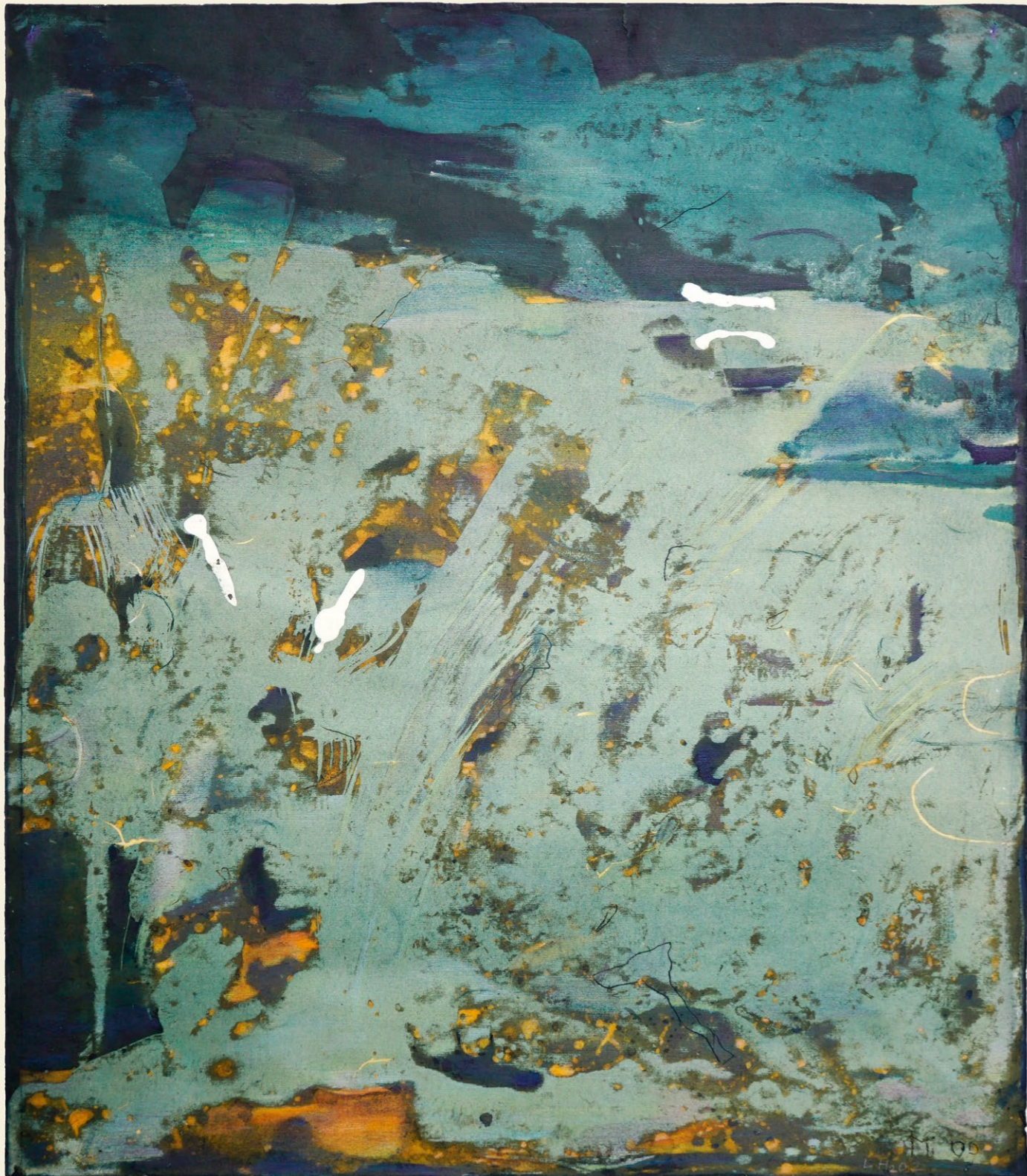
starý měsíc – zlomená křídla 2, 2014 autorská technika, 50 × 65 cm