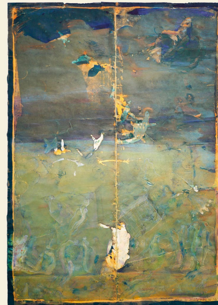
sestup dolů, 2014 autorská technika, 50 × 70 cm