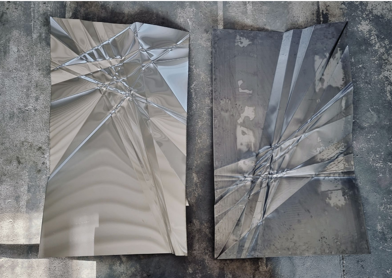
< origami I-II , 2021, ocel, nerezová ocel, 250 × 150 × 30 cm