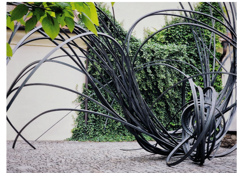
< smyčce , 2020, ocel, 700 × 450 × 250 cm