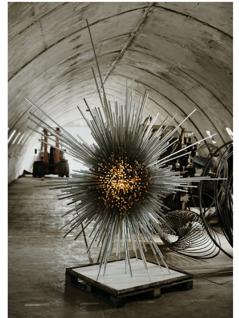
hvězda , 2020, galvanizovaná ocel, 200 × 200 × 200 cm