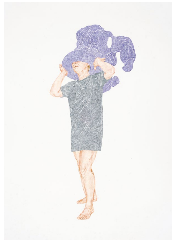
Endemit 2 , 2021, pastelka na papíře, 100×70 cm