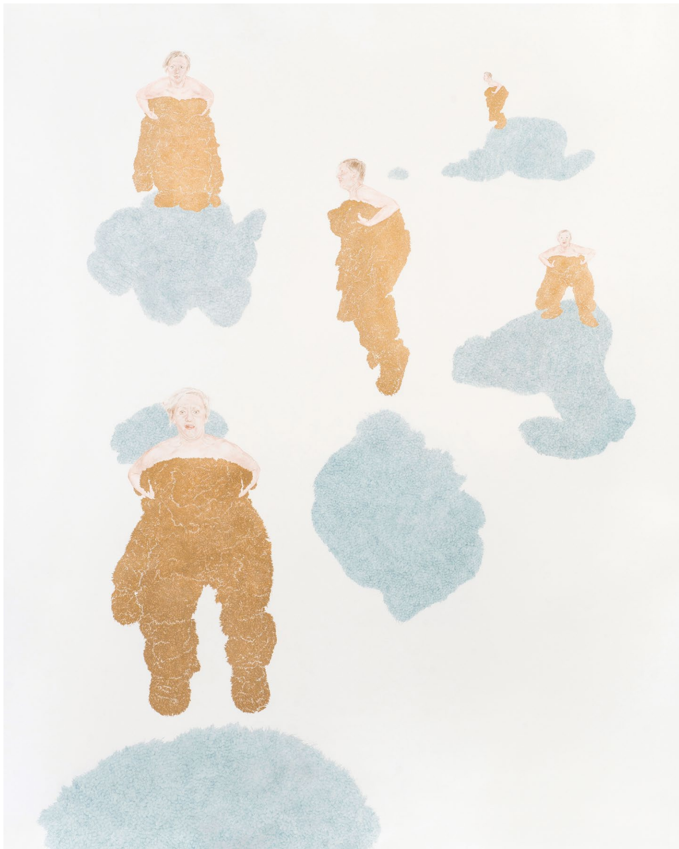
Mezi mraky, skáču taky , 2020 pastelka, gelový fix, 180×150 cm