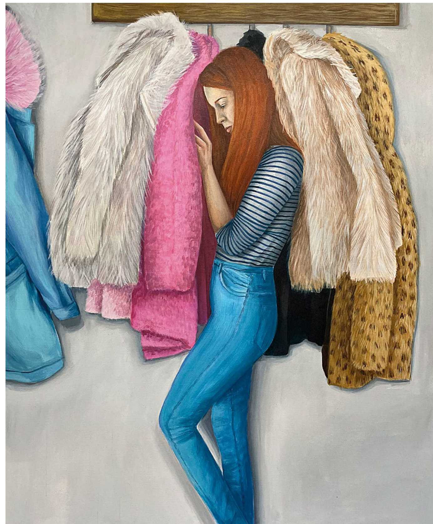
hiding place, 2021 akryl na plátně, 90 x 110 cm