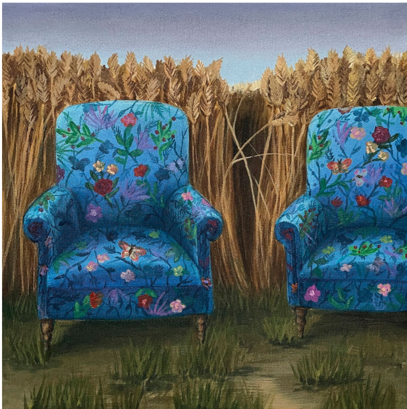
hide and seek, 2021 akryl na plátně, 40 x 40 cm