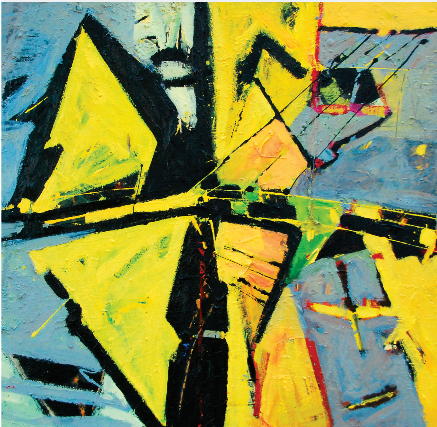
opus 1, olej /plátno