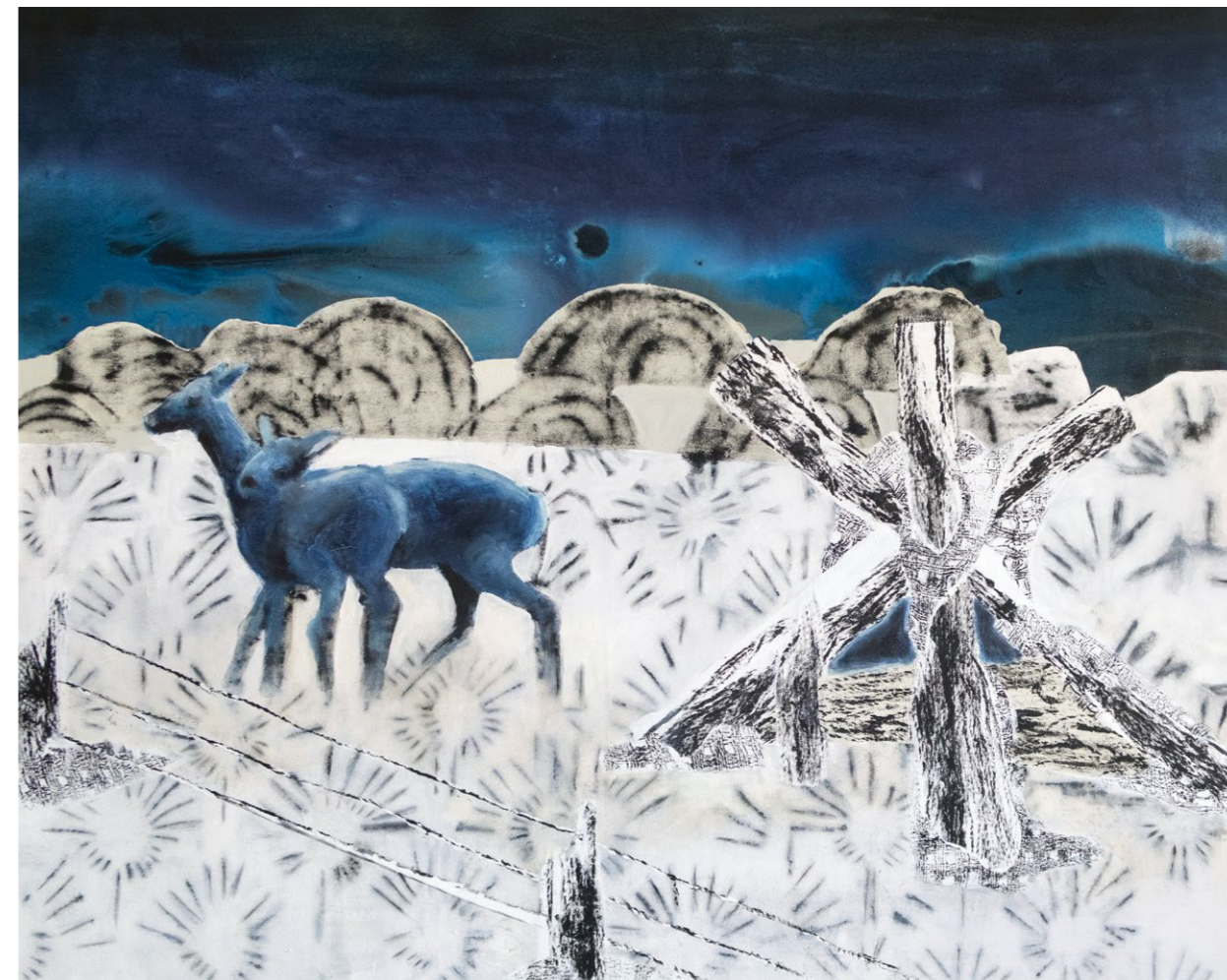
> tamější záře, 2024, akryl na plátně, 150×125 cm