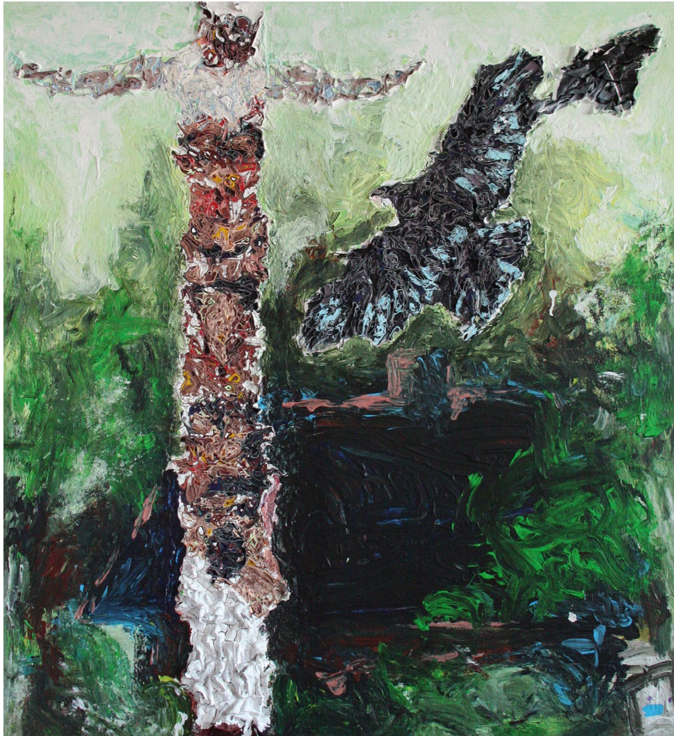
<< na titulní straně kde dávají lišky dobrou noc , 2023, akryl na plátně, 140 x 115 cm