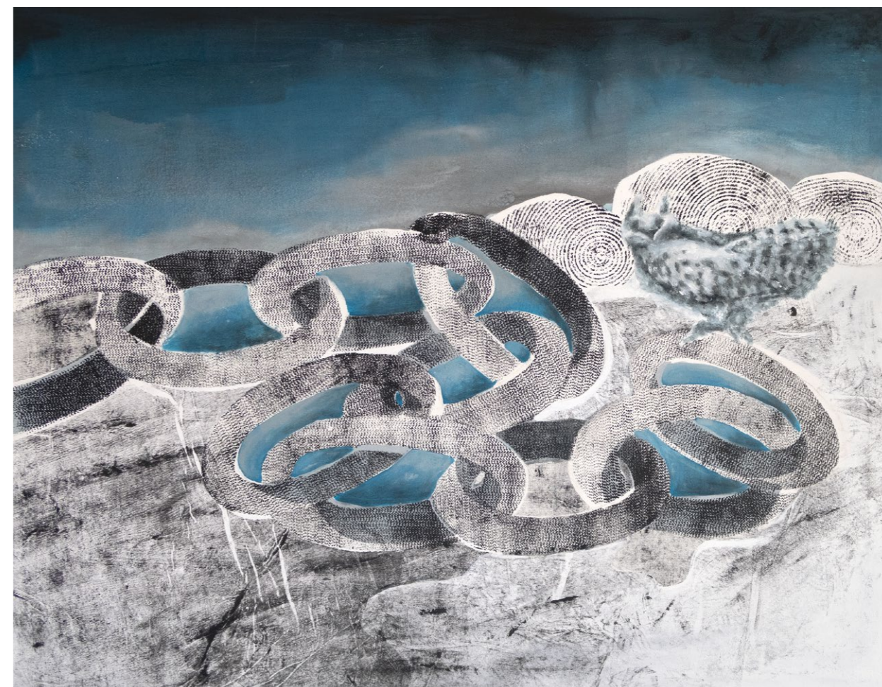
ve spojení, 2024, akryl na plátně, 140×110 cm