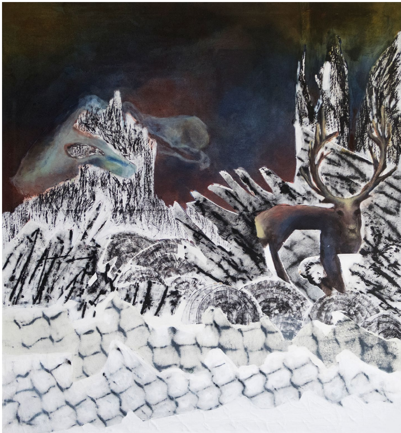
tanec ve větru, 2023, akryl na plátně, 130×140 cm