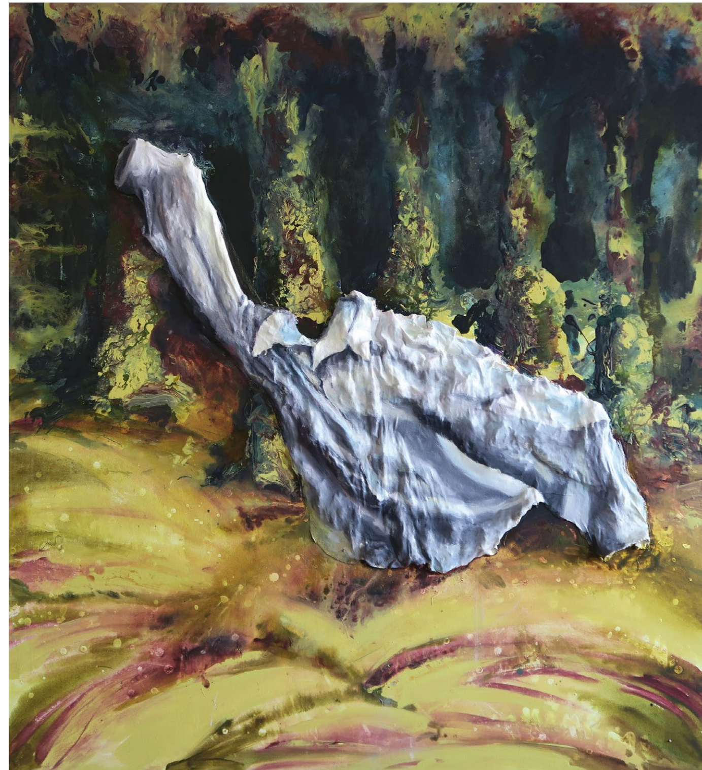
< 1. krkavec, 2022, akryl, plátno na plátně, 130 x 125 cm 3. krkavec, 2022, akryl, plátno na plátně, 130 x 120 cm