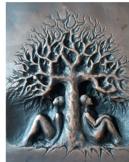
odpočinek, 2021, bronz, výška 25 cm

„její tvorba se vyznačuje žensky citlivým pochopením výjimečnosti řezbářského materiálu, jemnou poetickou modelací a výborným řemeslným zpracováním.“