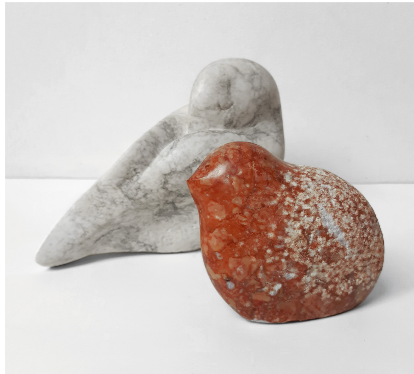
mláďata , 2021, alabastr, untersberský mramor, výška 15 a 10 cm