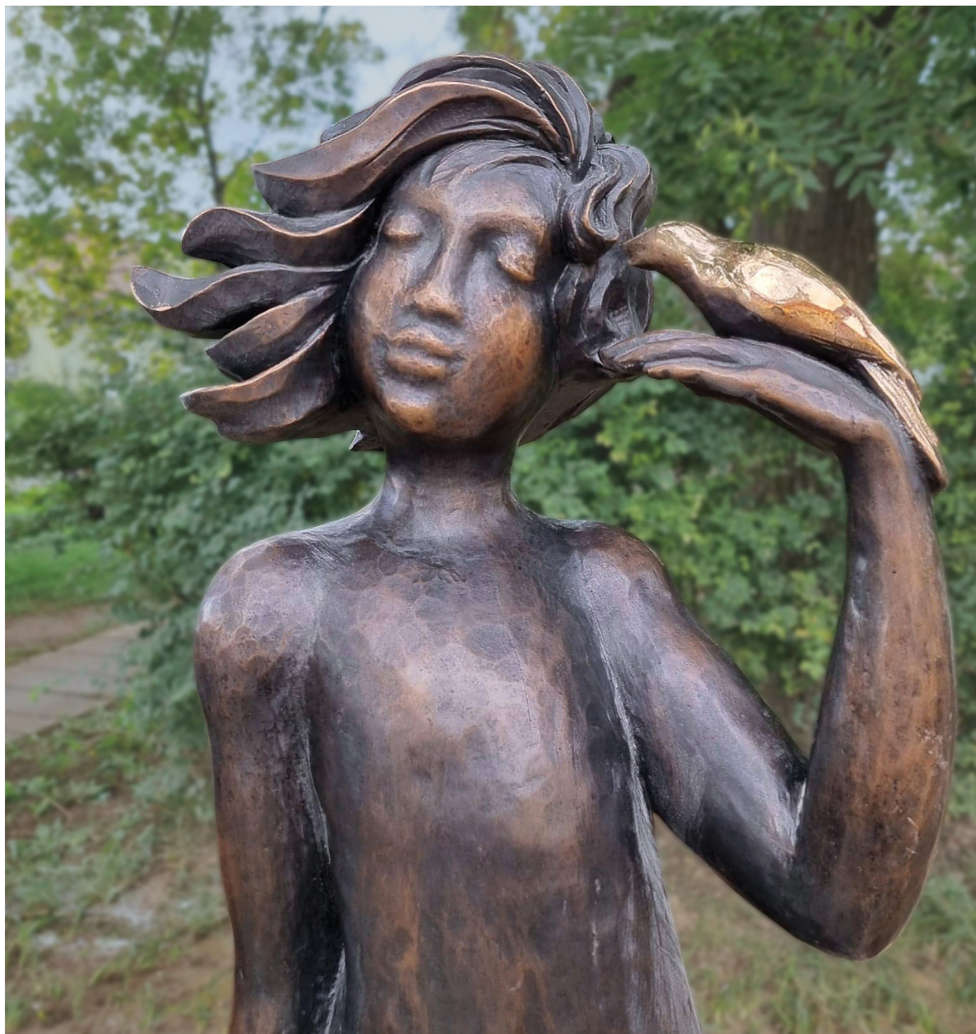
krása, 2022, bronz, výška 120 cm