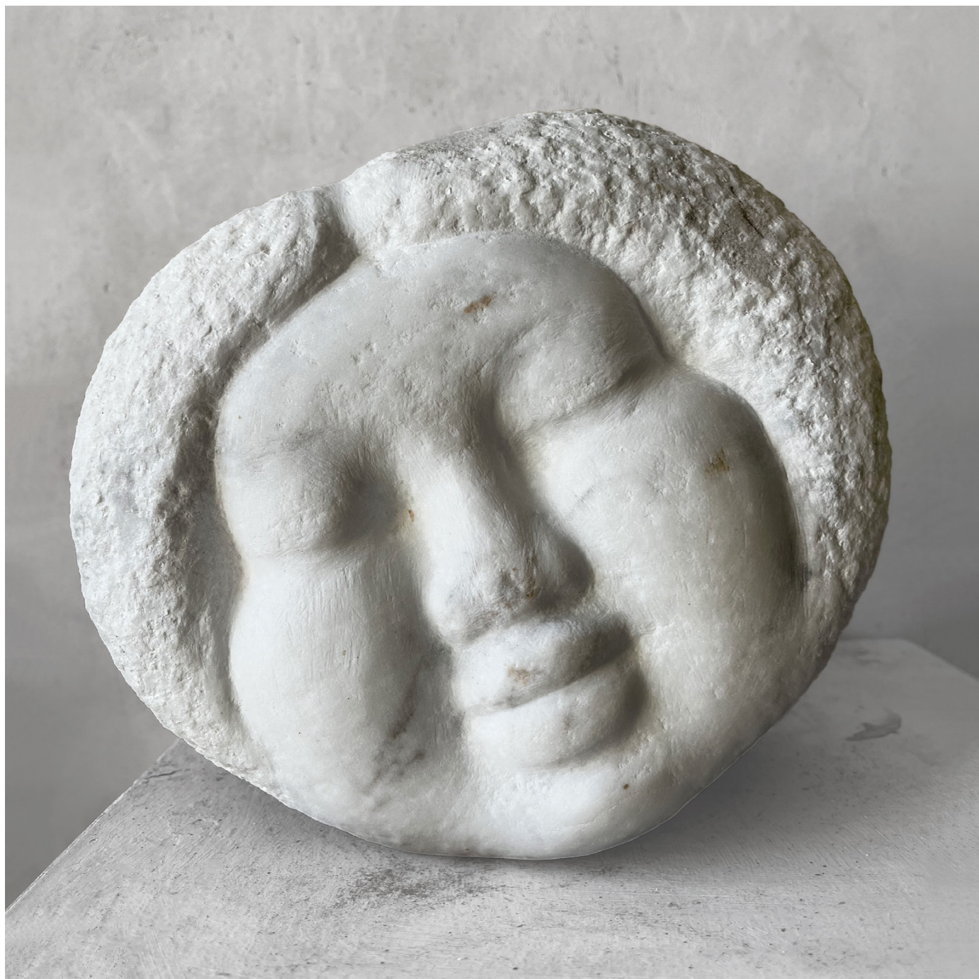
laskavost, 2024, mramor, výška 19 cm