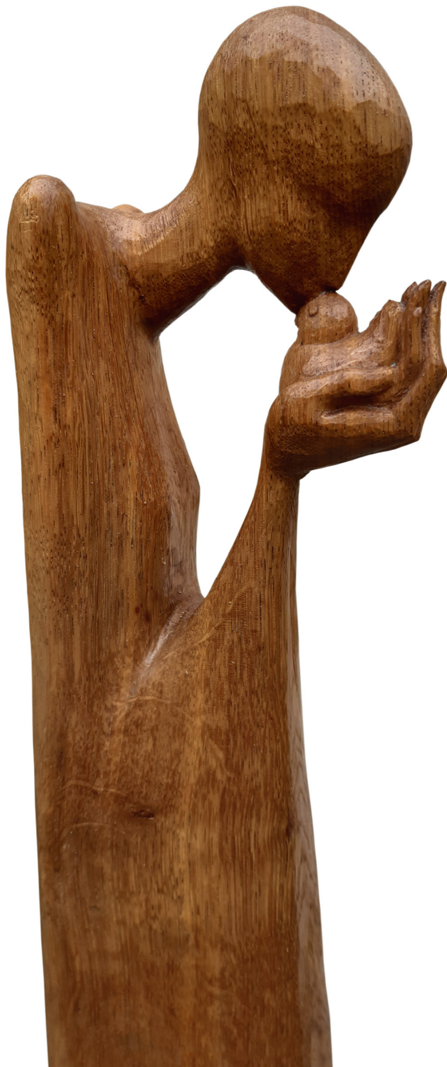
<< na titulní straně portrét neznámé , 2021, mramor, výška 20 cm něha , 2006, dub, výška 110 cm