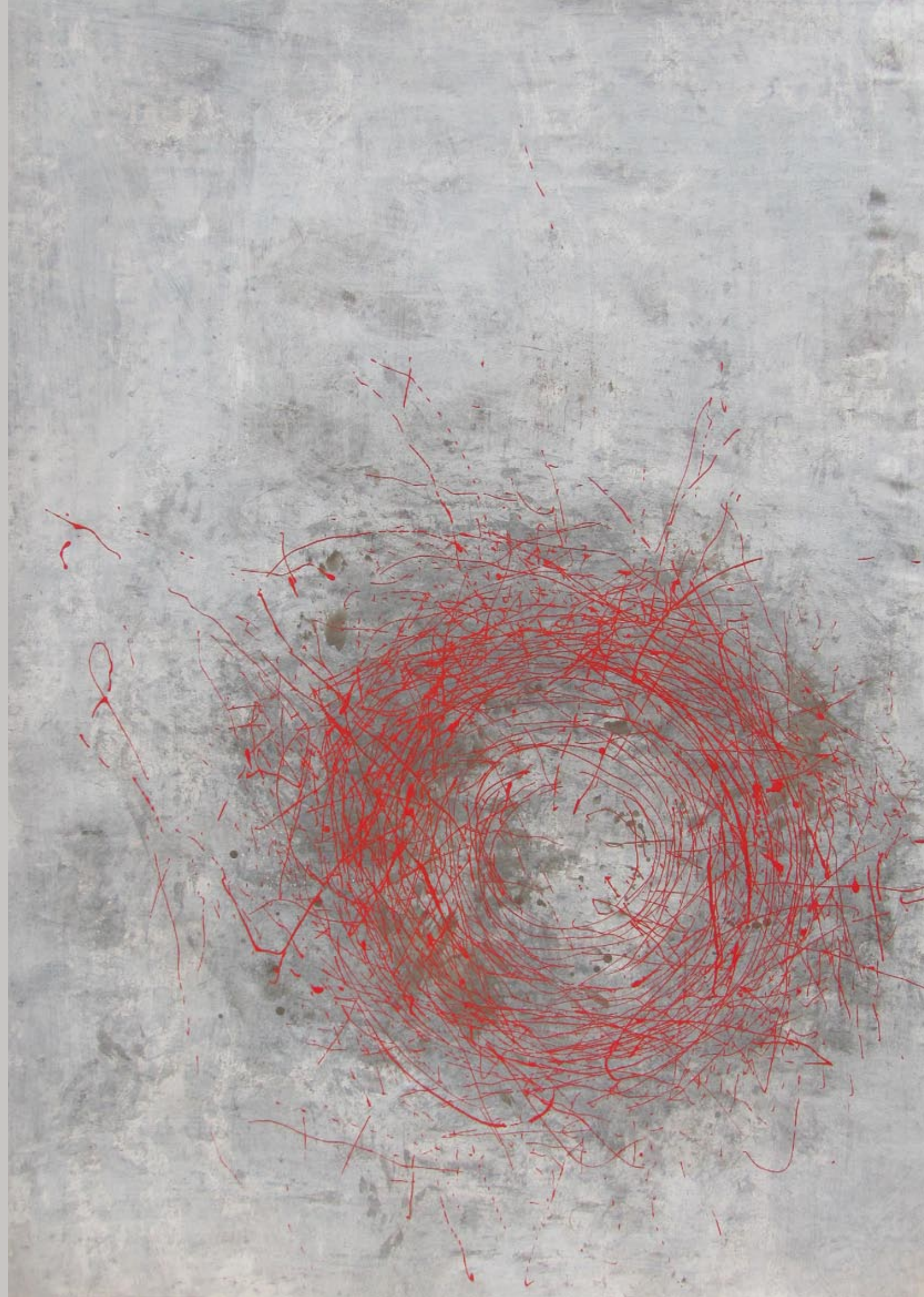
reprodukováné kresby pochází z většího cyklu z let 2003–2009