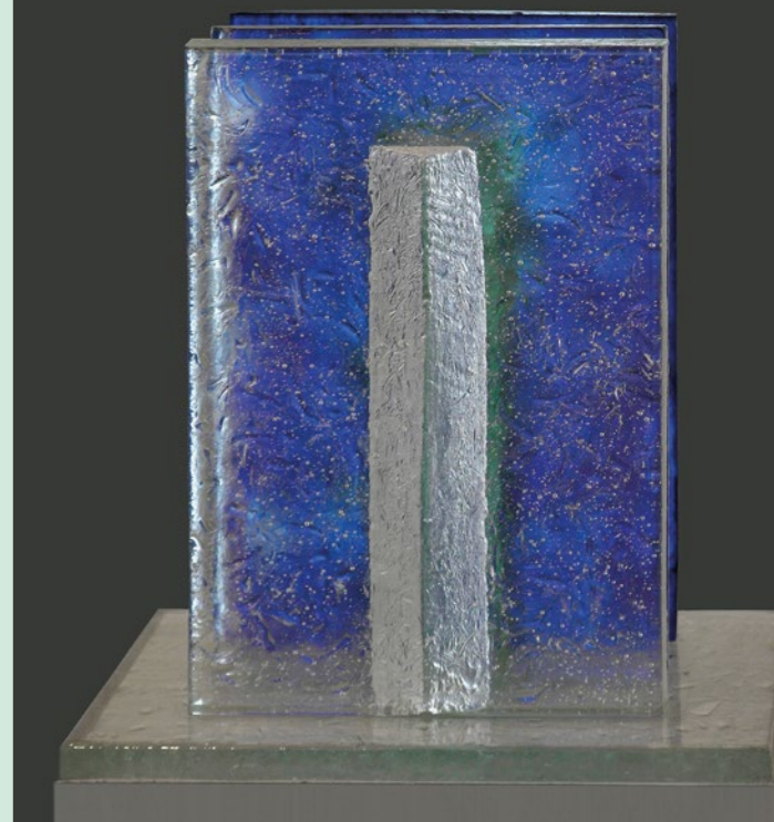
asymetrická brána, tavená skleněná plastika modrá brána, tavená skleněná plastika