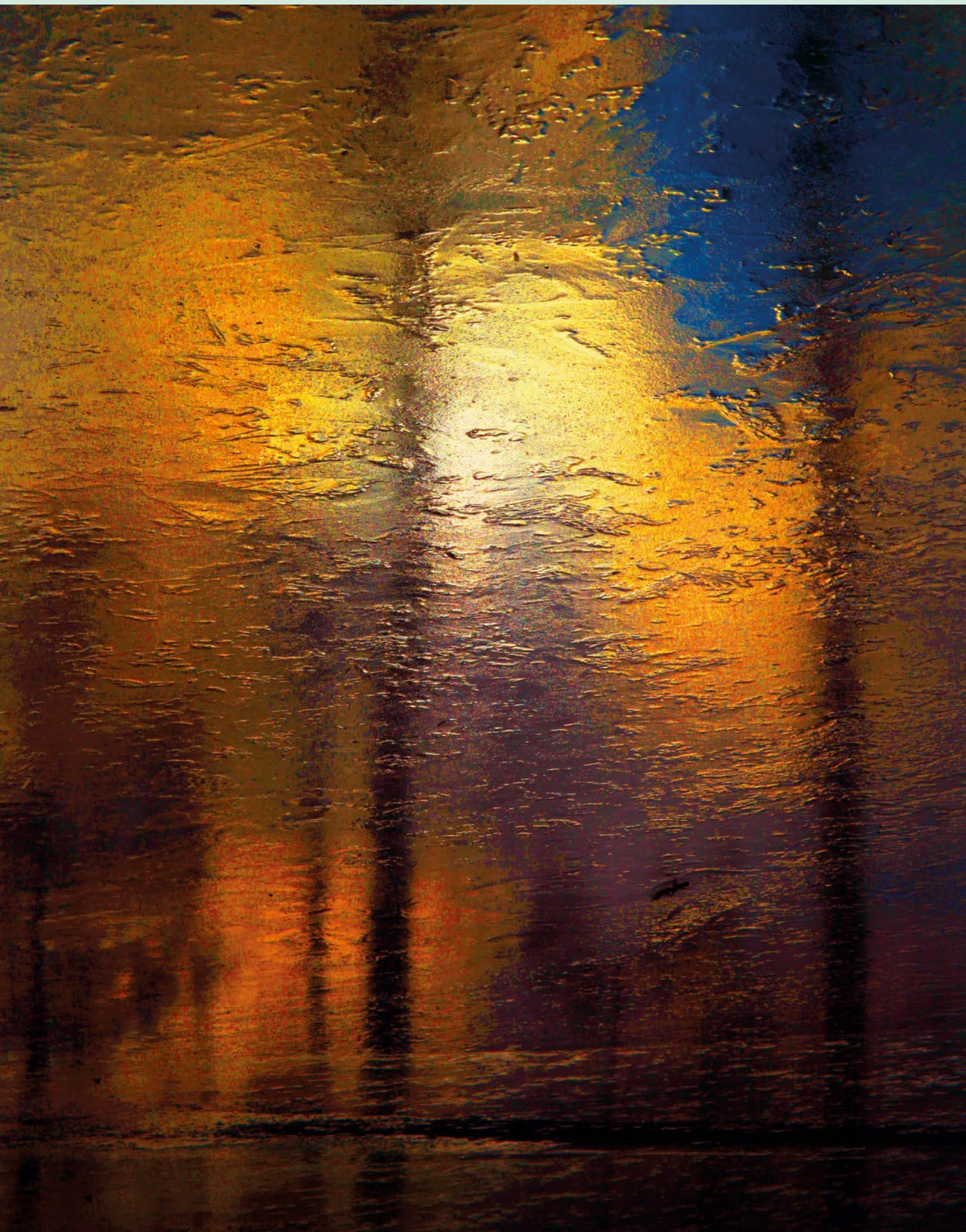
sklokrajina – hladina III. fotografie