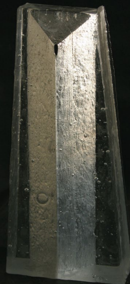
ivo binder, 2013