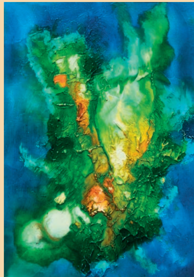
safír, olej na plátně