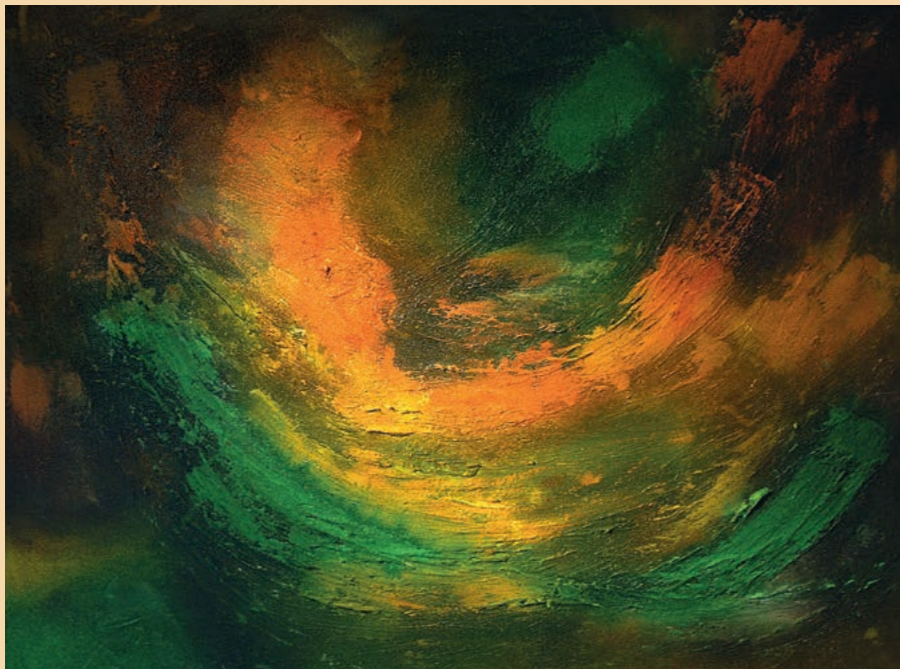
turmalín, olej na plátně