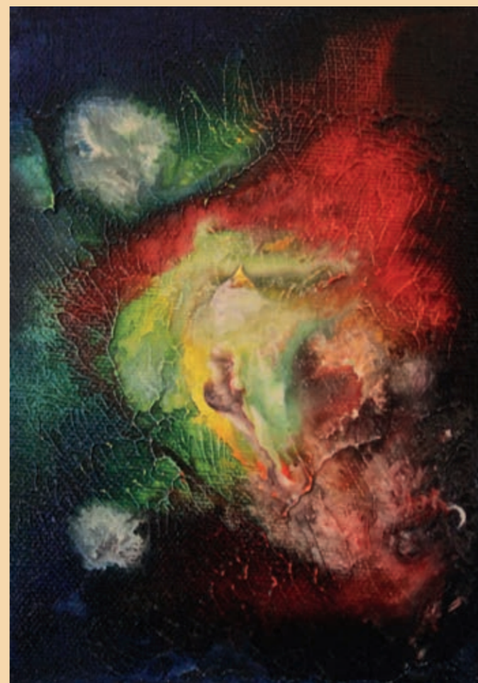
opál, olej na plátně