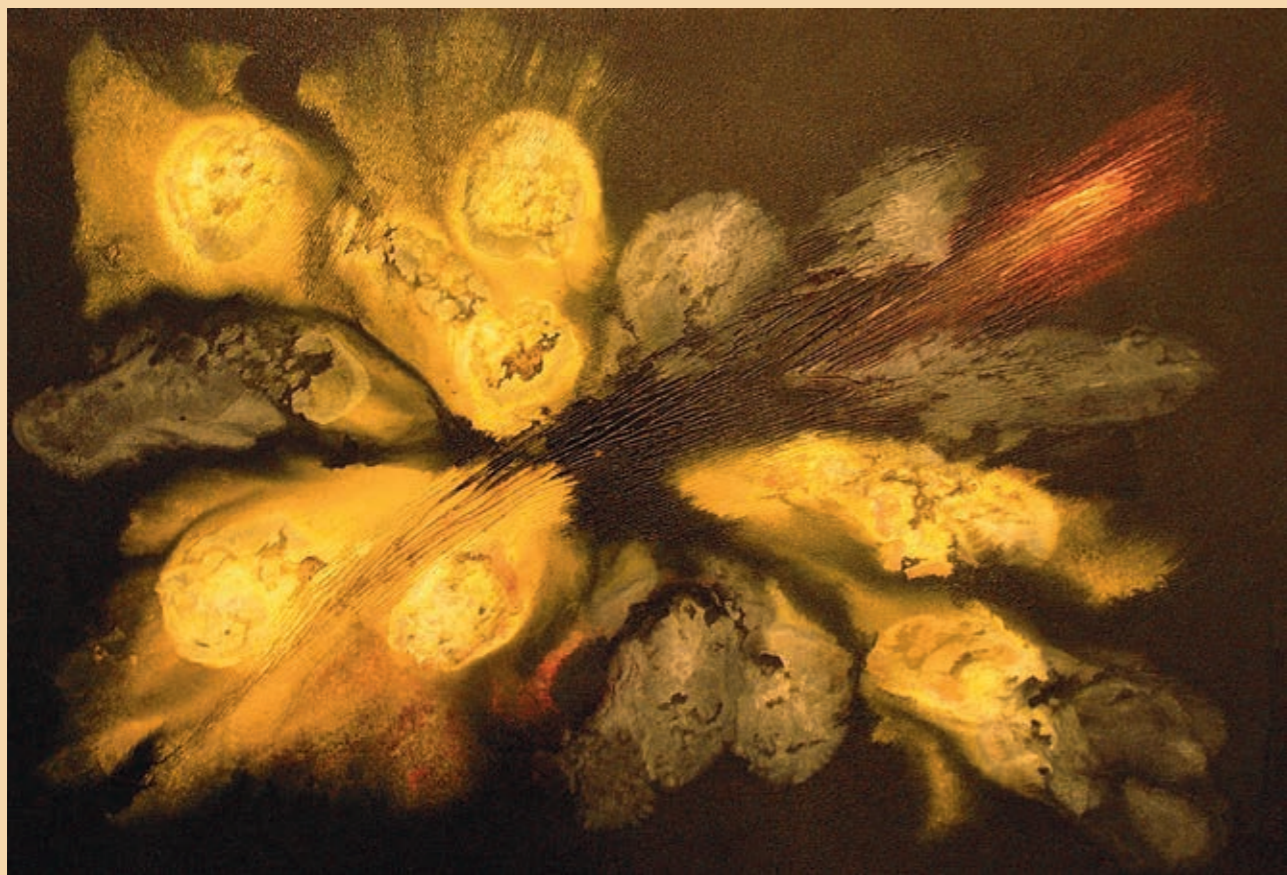
achát, olej na plátně