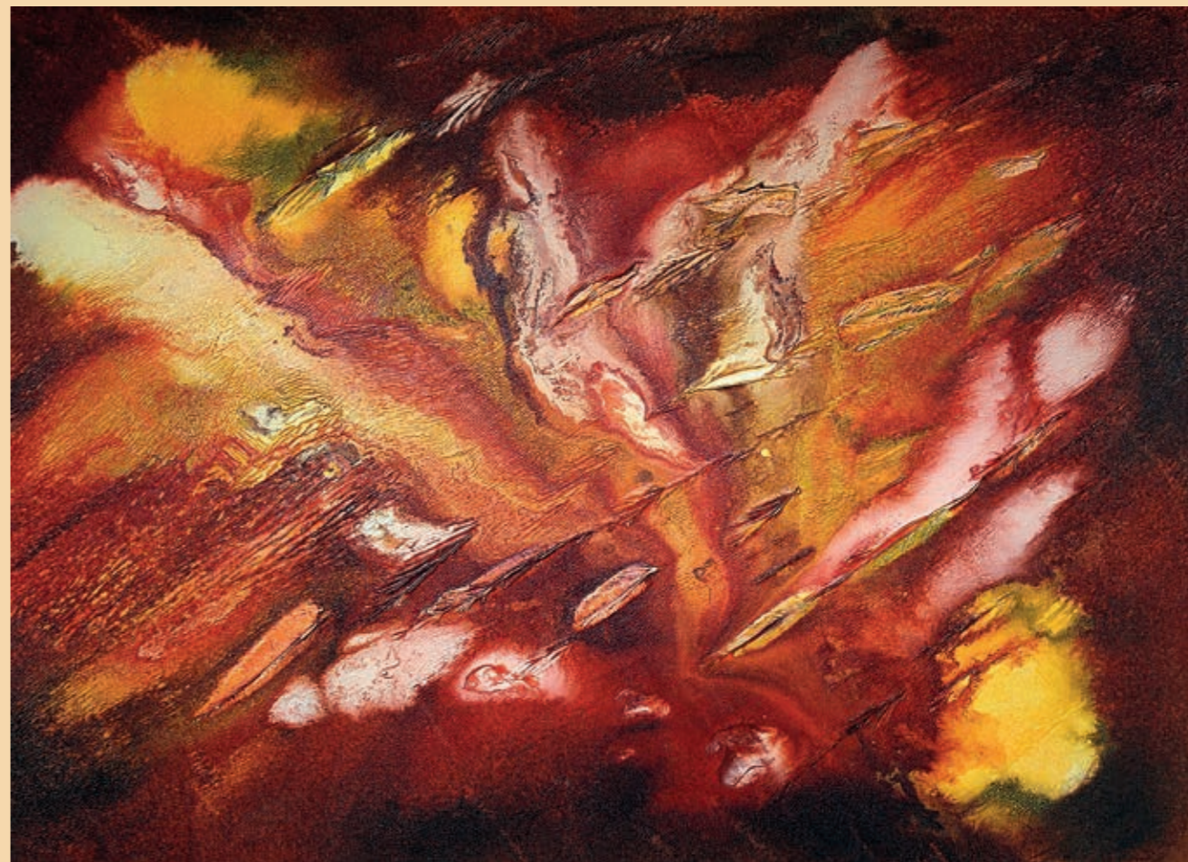
karneol, olej na plátně