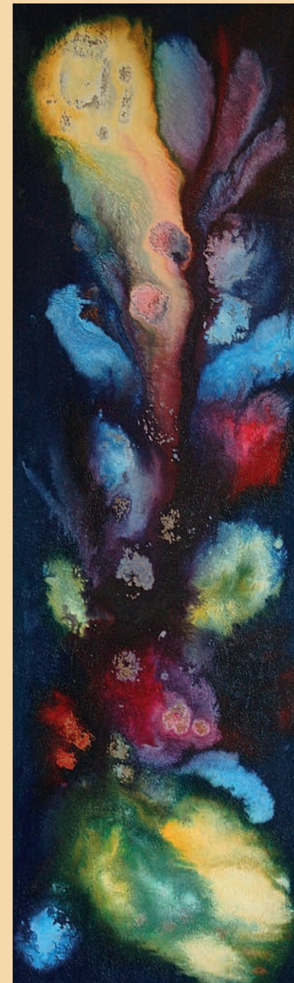
opál, olej na plátně

generální ředitel bavorských státních sbírek nová pinakotéka