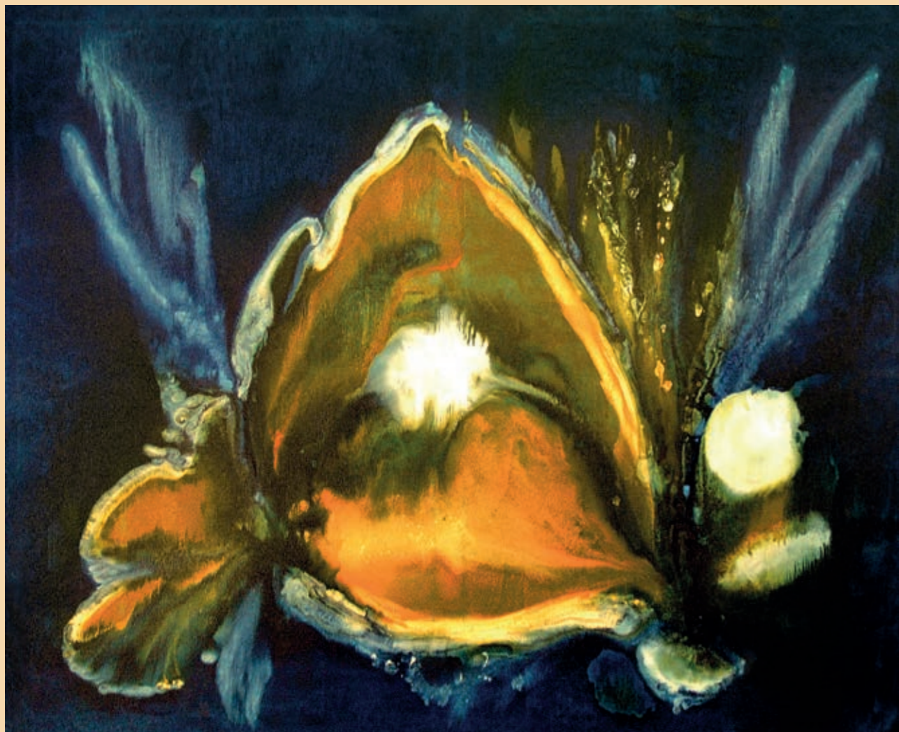
labradorit, olej na plátně