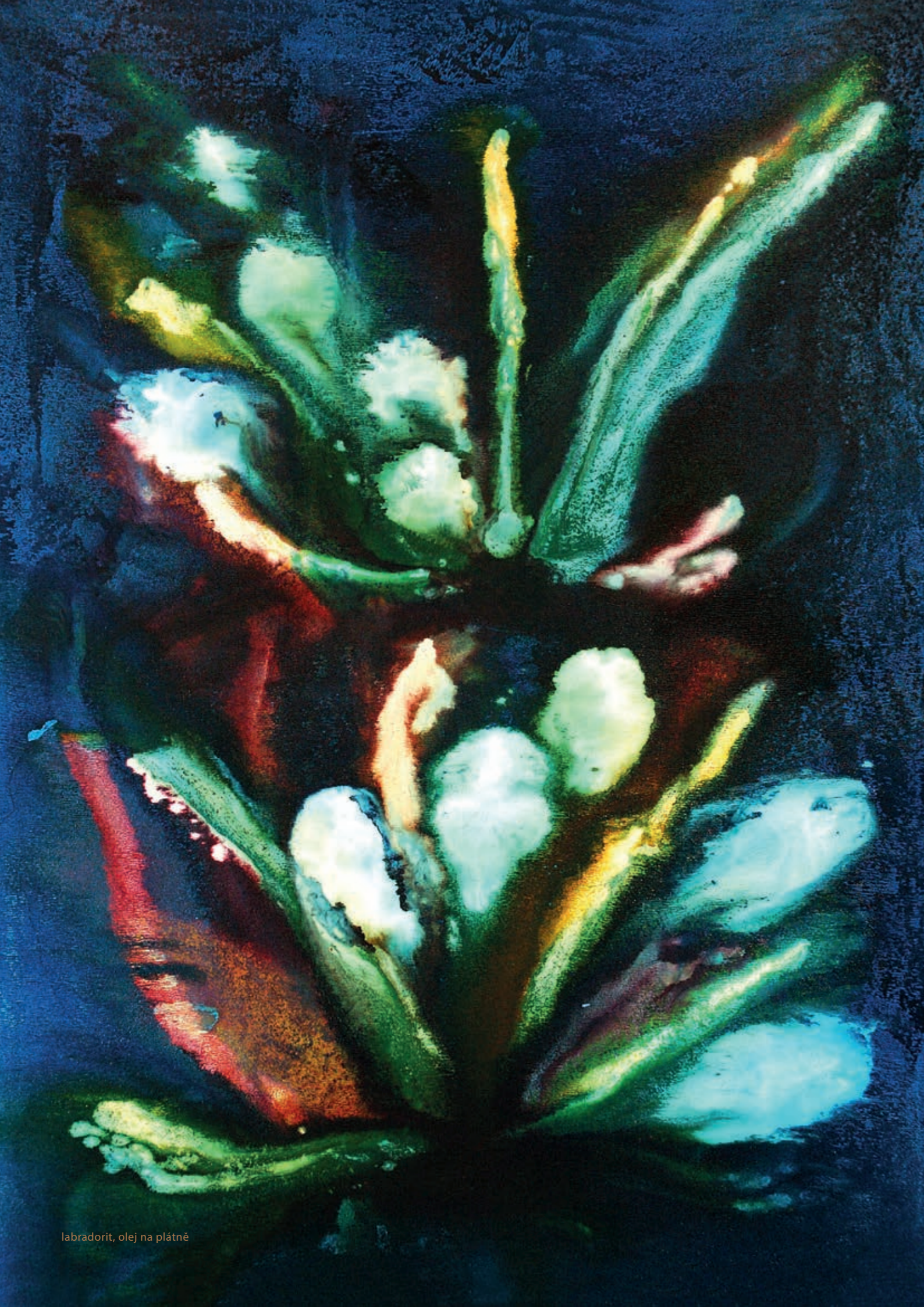
labradorit, olej na plátně