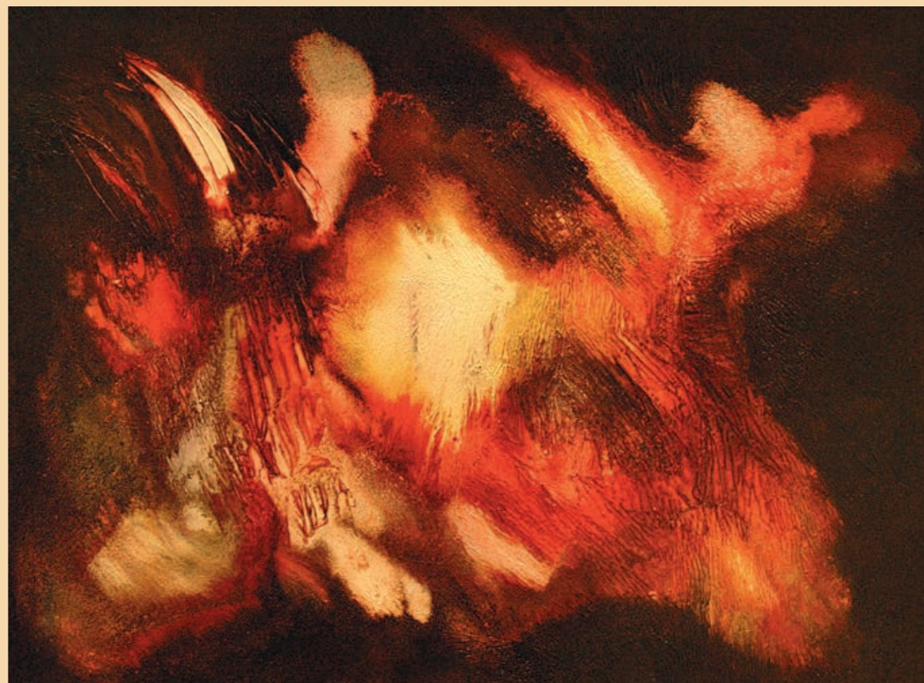
achát, olej na plátně