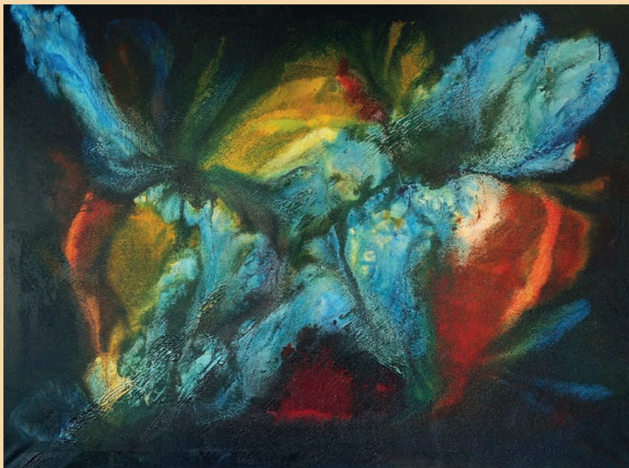
opál, olej na plátně