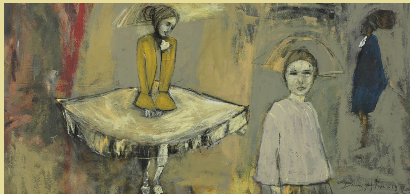
> jeviště II 2014 | akryl a grafit na plátně