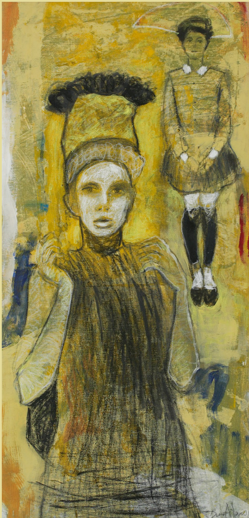
> tanečnice s žlutým pozadím 2014 | akryl a grafit na plátně