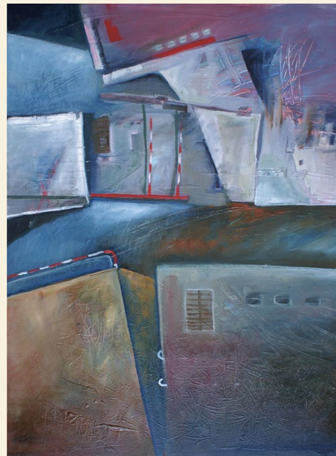
únikový východ | 2011 | olej, plátno