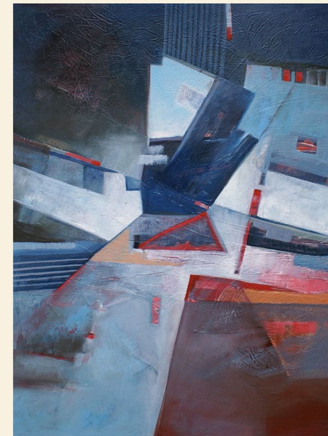
kolize v prostoru | 2011 | olej, plátno