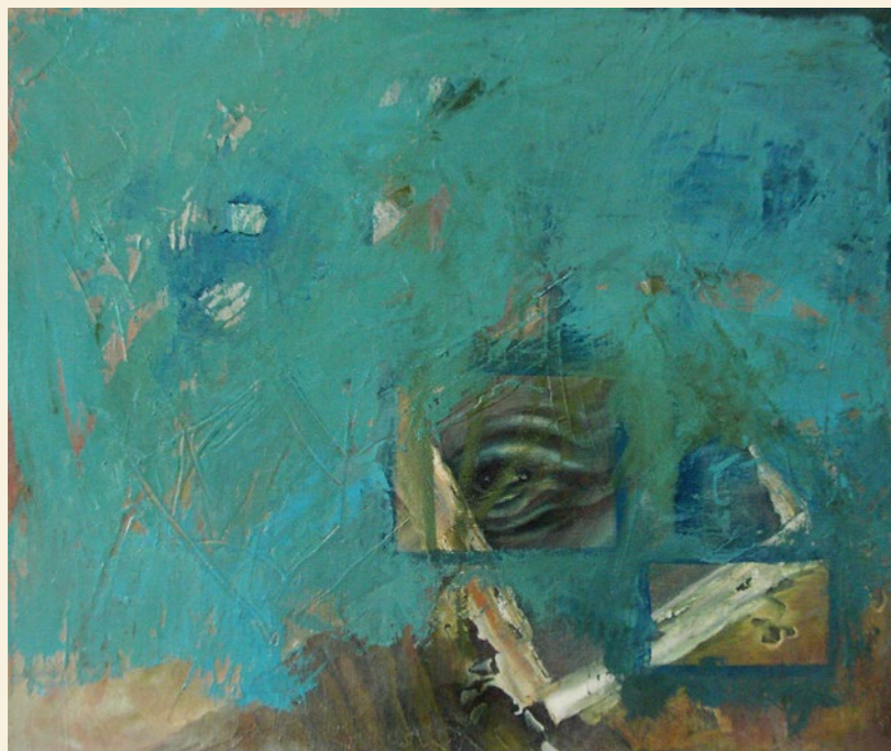
oko moře | 2006 | olej, plátno útes | 2006 | olej, plátno