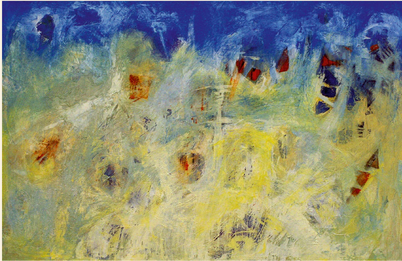
korálový útes | 2006 | olej, plátno bouře | 2005 | olej, plátno