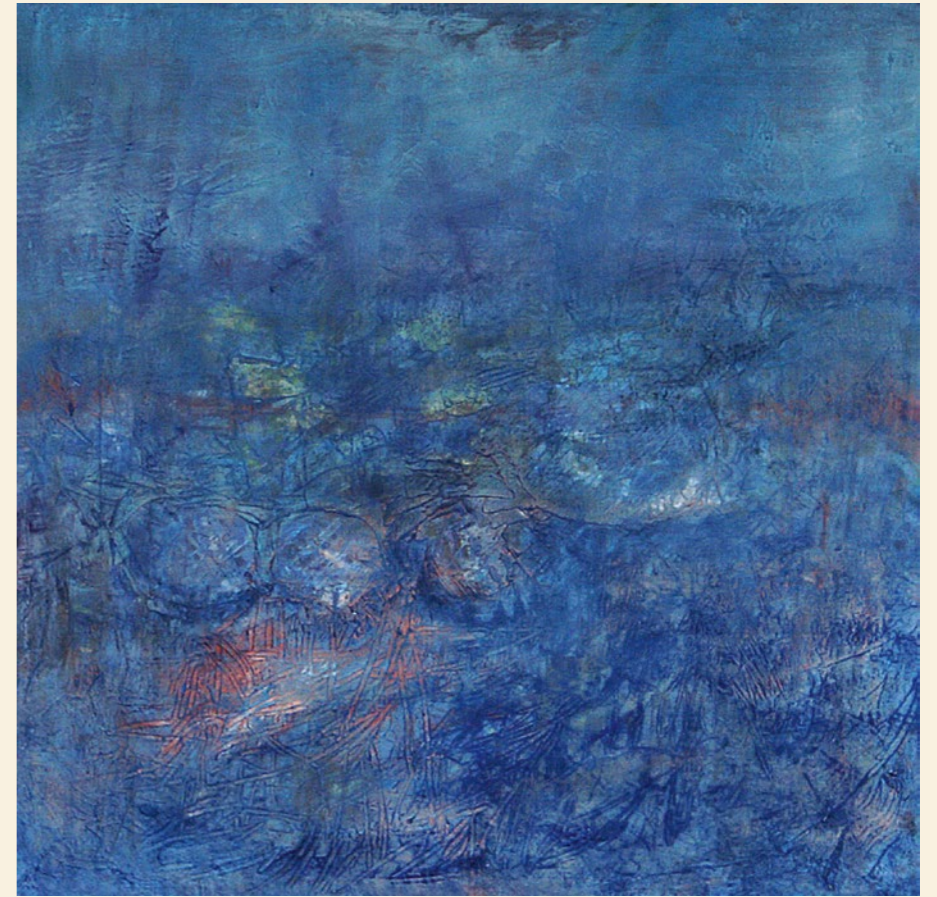
modrý sen | 2006 | olej, plátno kalymnos | 2005 | olej, plátno