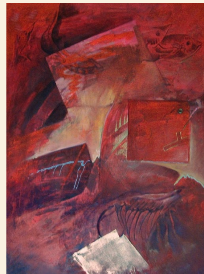
proudy | 2005 | olej, plátno modrá hlubina | 2005 | olej, plátno