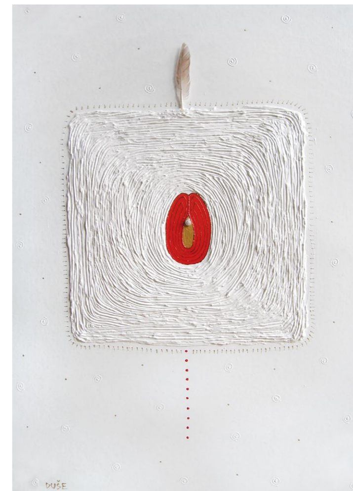
duše, 2008 akryl na lepence, kombinovaná technika, 70 x 100 cm