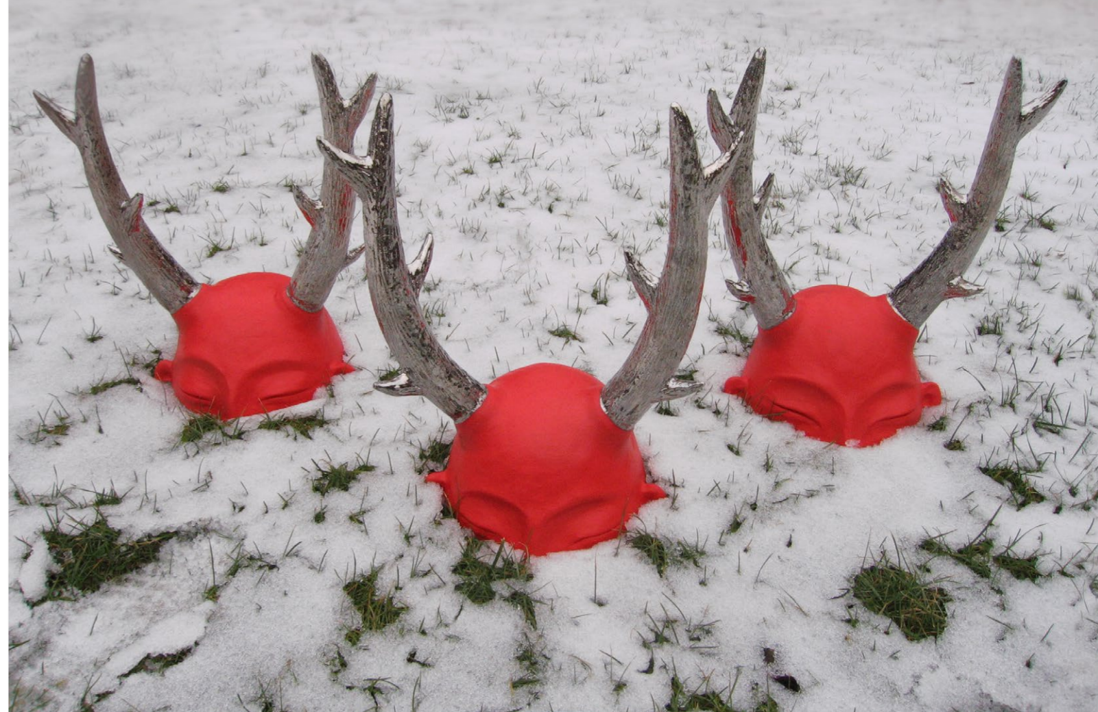
na číhané, 2013 šamot, platina, kombinovaná technika