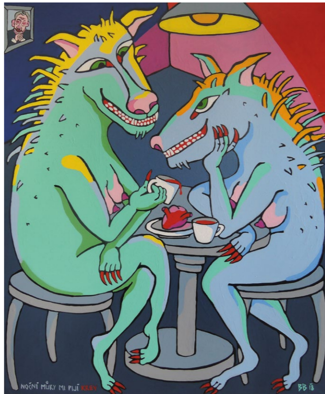
chyť si svůj talíř, 2018 akryl na plátně, 100 x 120 cm