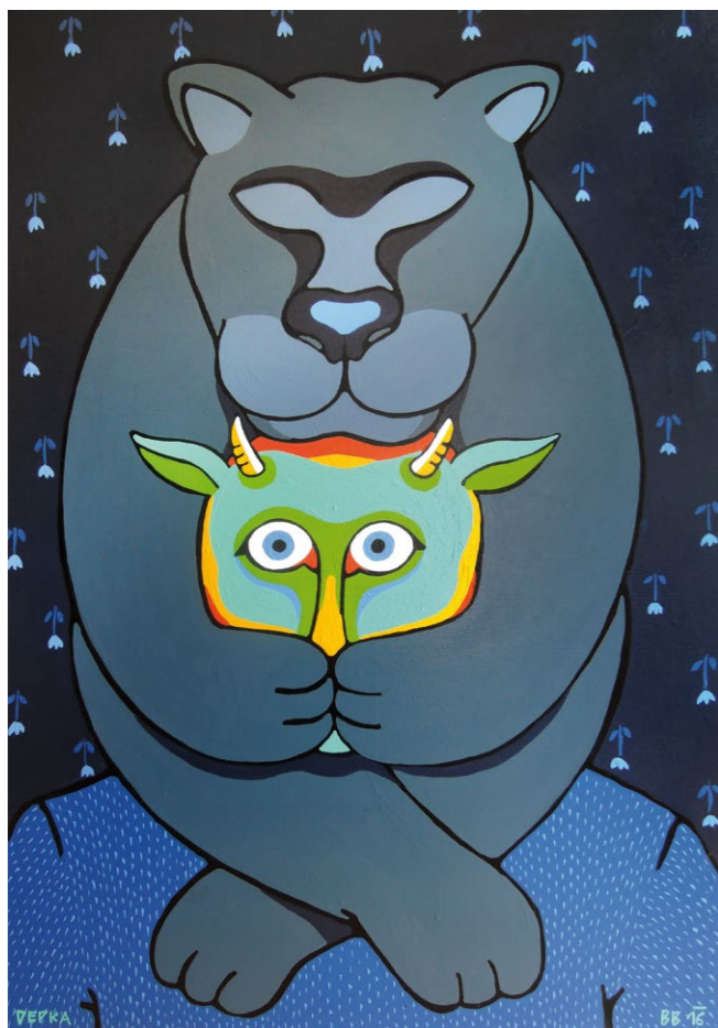
<< slyším tě, 2018 šamot, kombinovaná technika