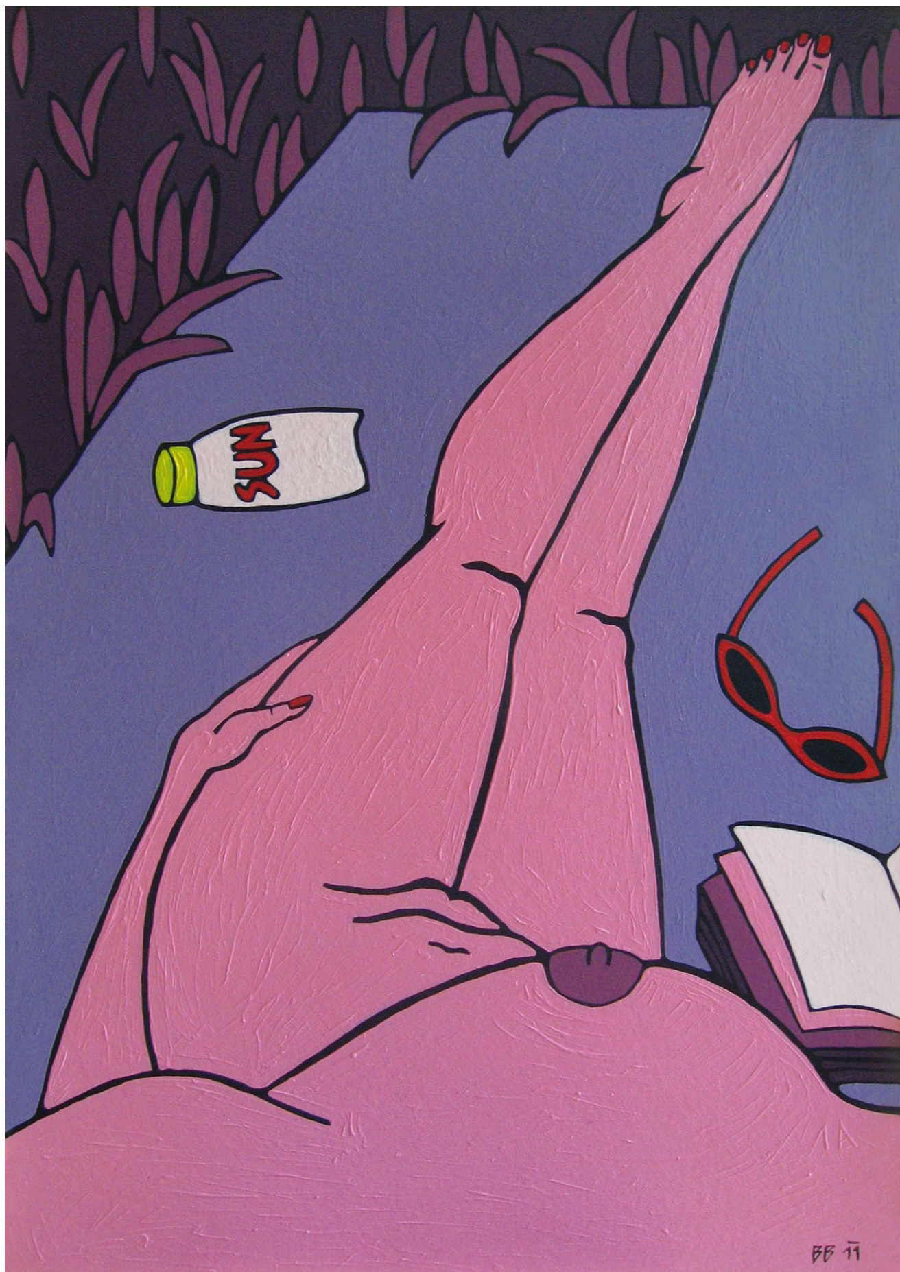
sun, 2011 akryl na lepence, 70 x 100 cm