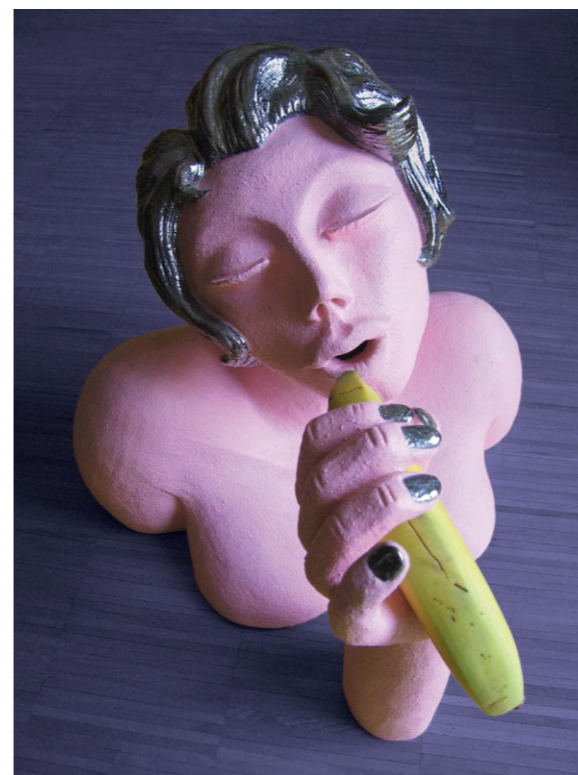
happy birthday, dr. freud!, 2011 šamot, platina, kombinovaná technika