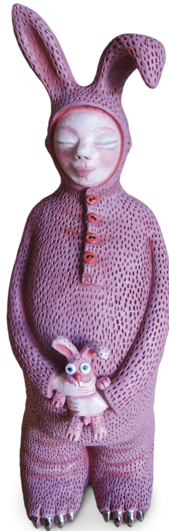
poslední jednorozec, 2010 šamot, platina, kombinovaná technika