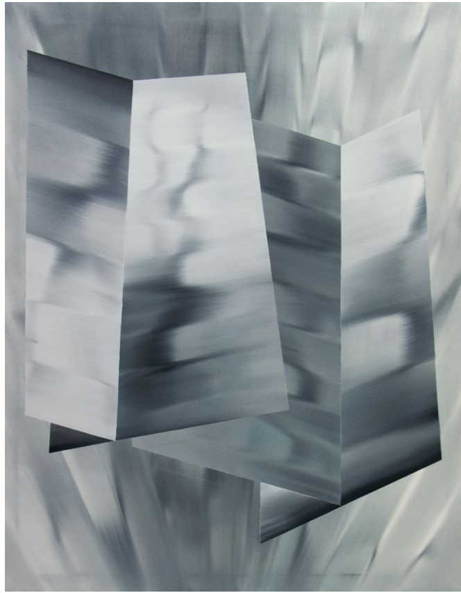
<< bez názvu, 2018 olej na plátně, 170 x 140 cm