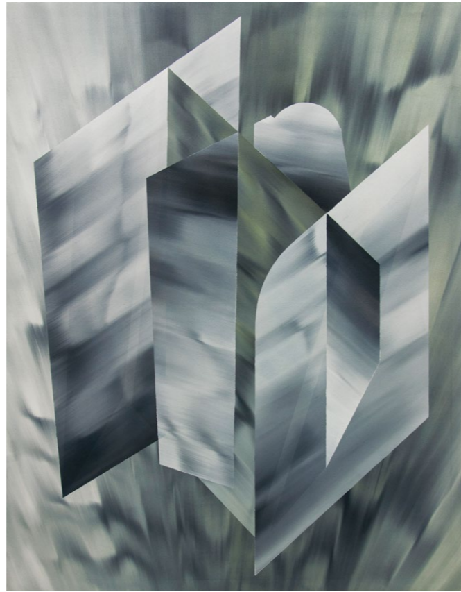
bez názvu, 2018 olej na plátně, 145 x 115 cm