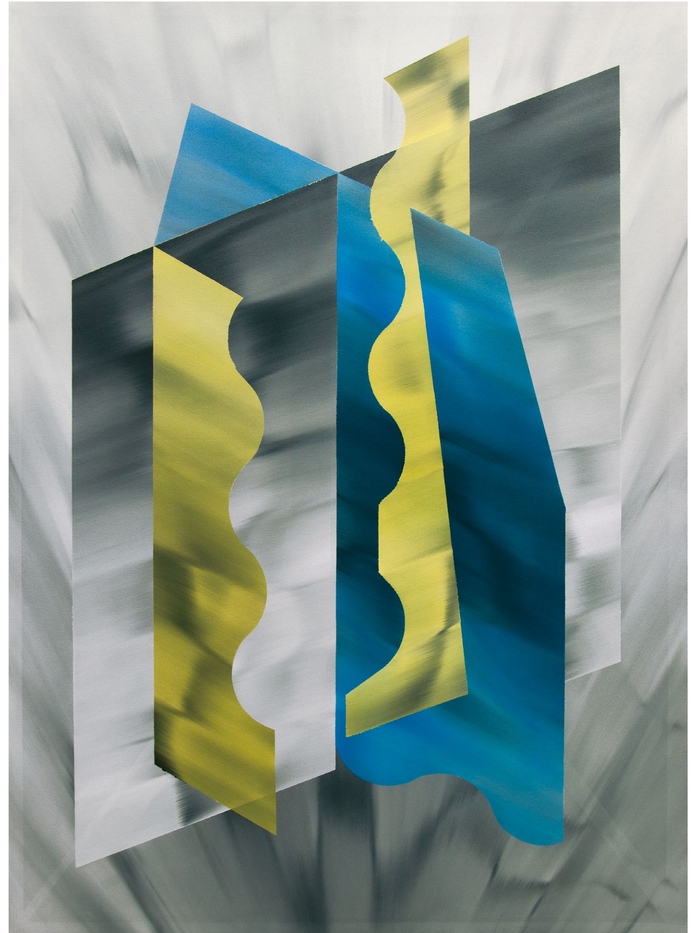
bez názvu, 2018 olej na plátně, 190 x 140 cm